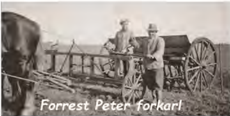
Forrest Peter forkarl

På Barfredshøj vi fester her i Dag, faldera for Laden den er nu fyldt op til Tag, faldera og nu i Aften vi os mere skal, faldera og have rigtig god og dejlig Mad, faldera