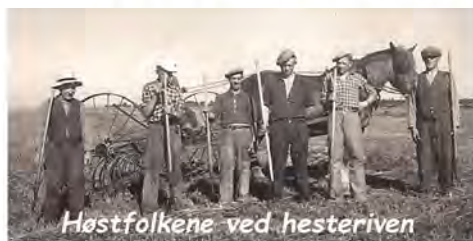
Høstfolkene ved hesteriven

Naar de var færdig med at høste, blev der holdt Høstgilde saa spiste vi alle i Kælderen, baade Herskabet, Eleverne, Husmænd, og Fodermestre, saa havde Husmændene Konerne med, vi fik god Mad, det var varm Mad. Saa lavede vi Piger en Sang, der vankede ogsaa lidt Spiritus saadan en Aften. Fruen hjalp os med at vaske op, saa vi kunde blive færdig og komme op paa Kornloftet og danse, Herskabet var ogsaa med deroppe, men Herren gik tidligt, det var ikke noget for ham, men Fruen holdt altid længe ud hun morede sig.