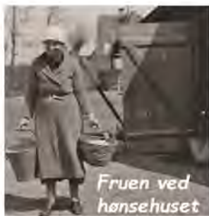
Fruen ved hønsehuset

Hver Maaned vaskede vi Storvask, saa kom Fodermesterens Kone og hjælp til, der var ogsaa to voksne Sonner, der kom hjem med Vasketøj, og alt Sengetøjet om os alle sammen, saa der var noget at rulle og stryge bagefter. Som regel havde vi fri et par Timer hver Eftermiddag.