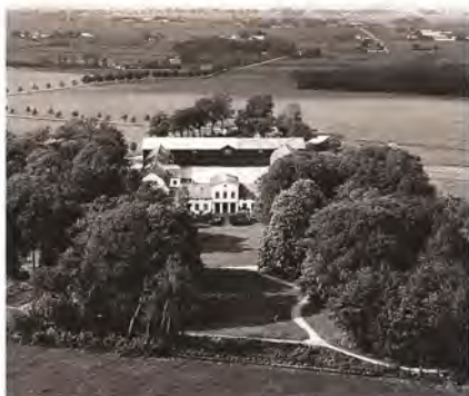
EN PROPRIETÆRGÅRD PÅ VESTEGNEN