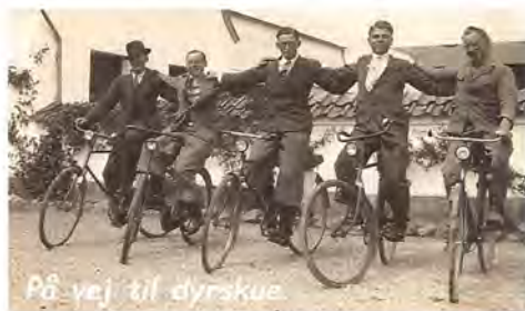
På vej til dyrskue

Naar de var færdig med at høste, blev der holdt Høstgilde saa spiste vi alle i Kælderen, baade Herskabet, Eleverne, Husmænd, og Fodermestre, saa havde Husmændene Konerne med, vi fik god Mad, det var varm Mad. Saa lavede vi Piger en Sang, der vankede ogsaa lidt Spiritus saadan en Aften. Fruen hjalp os med at vaske op, saa vi kunde blive færdig og komme op paa Kornloftet og danse, Herskabet var ogsaa med deroppe, men Herren gik tidligt, det var ikke noget for ham, men Fruen holdt altid længe ud hun morede sig.