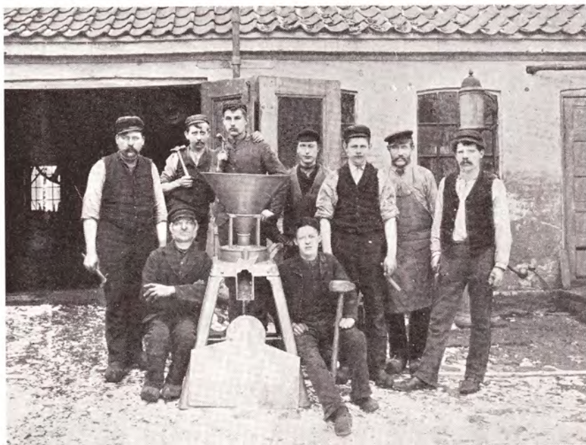
Gaardsplads og Værkstedbygning

Om Forholdet og Tonen paa Værkstedet mellem Mestre, Svende og Lærlinge er intet særligt at berette. Vi Lærlinge havde megen Respekt for Mestrene og Svendene og tillod os ingen Friheder overfor dem. Korporlig Straf blev aldrig anvendt. At vi Lærlinge indbyrdes kunde finde paa »Drengestreger«, er vel ikke mærkeligt. Som Eksempel kan anføres: Naar en ny Lærling begyndte paa Værkstedet, skulde han »døbes«, have »Buksevand«.