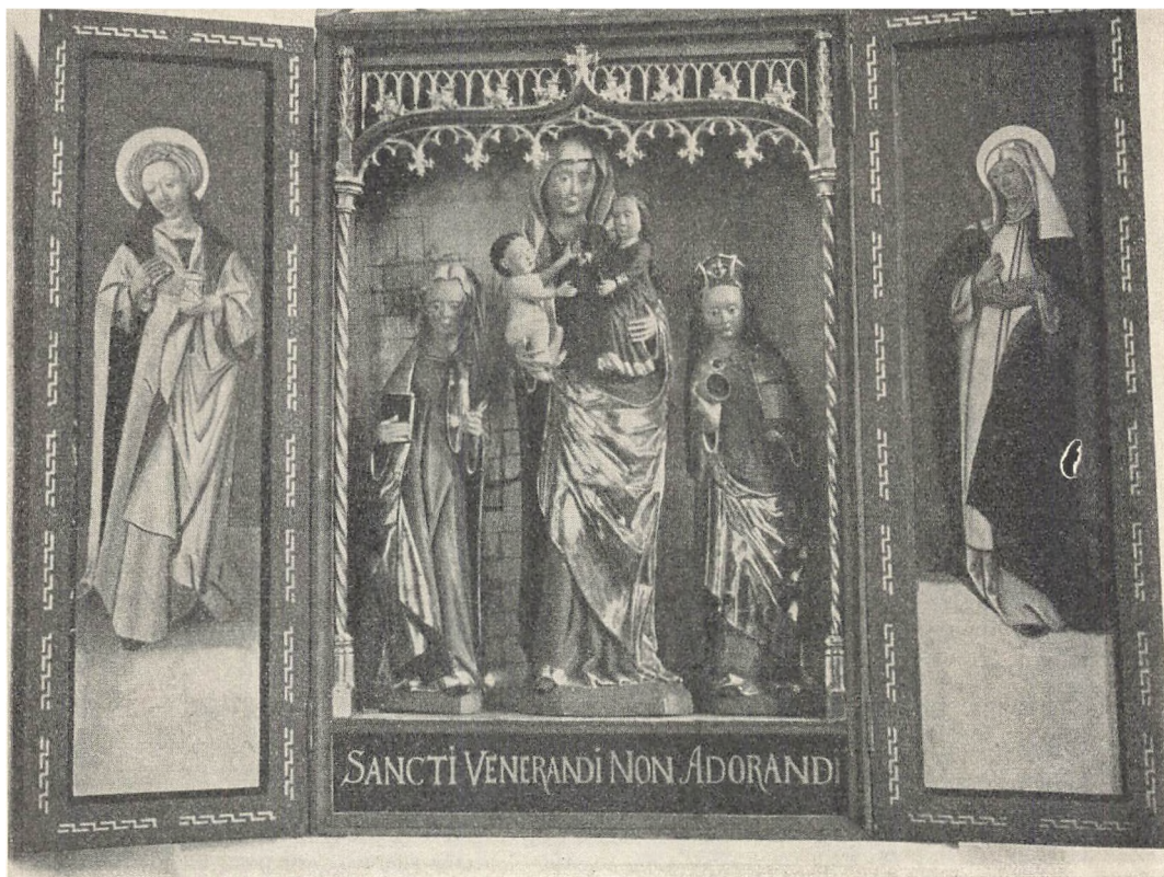
Katolsk sidealtertavle fra Hviding kirke med den latinske indskrift: Helgener bør æres, men ikke tilbedes.

og i Gram sogn. Der er dog sikkert mange fra Hviding herred, som er draget over Gels å for i Enderupskov at besøge den hellige kilde, der var indviet til helgenen St. Thøger. I Hviding herred kendes kun to helligkilder, den ene fandtes i Arrild sogn tæt ved vejen mellem Arrild og Hønning, medens den anden lå i Skærbæk sogn umiddelbart vest for Padborg huse. Disse to kilder kan godt have været besøgt som hellige gennem århundreder, men sikre oplysninger herom forefindes ikke. Kildedyrkelsen er et levn fra den katolske tid, og det interessanteste minde herom fra Nordvestslesvig er helligkilden ved den nedbrudte St. Thøgers kirke i Enderupskov ved Gels å 7 .