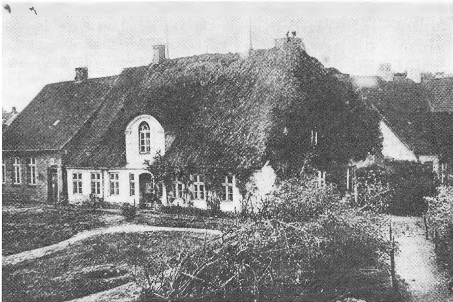
Fra 1752 havde Hviding og Nørre Rangstrup herreder fælles herredsfoged, der boede i herredsfogedboligen i Toftlund. Den gamle bygning, der blev revet ned i 1911, lå, hvor nu domhus og arrest ligger.