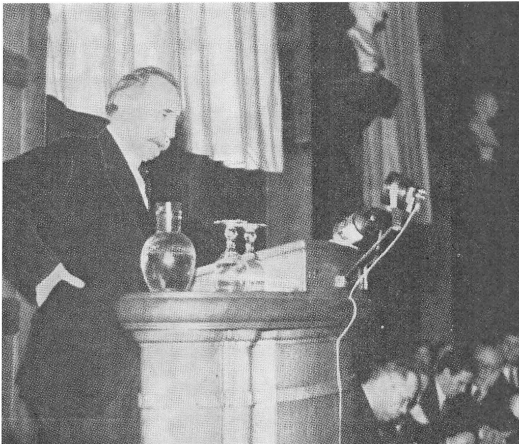
Sønderjydernes mangeårige talsmand, fhv. minister H. P. Hanssen, holder radiotale i Studenterforeningen den 13. februar 1936.