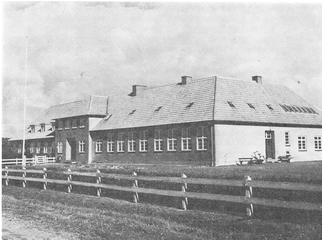
Hviding skole efter indvielsen 9. september 1939.