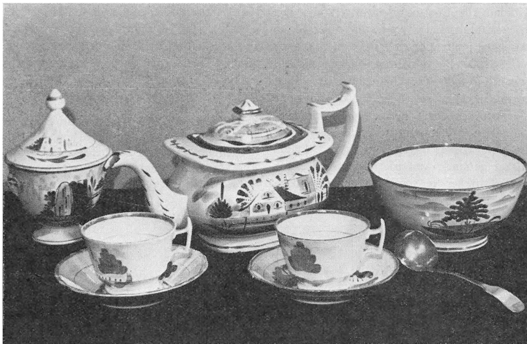
Engelsk, håndmalet testel fra New Castle upon Tyne. Stellet kan idag ses i museet i Wyk, Føhr. Til et festligt dækket tebord bruger man nu som før det fine sølvtøj – på billedet til højre en gammel flødeske.

ning: »Der They macht alles kräftlich und ergötzet zu starcker Liep.«