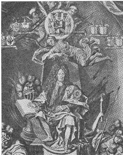
Grev Conrad Reventlow. (Udsnit af gravmæle med allegoriske figurer).

Det betød imidlertid ikke, at han havde opgivet enhver tanke om at komme i embede igen. 1692 26/3 meddelte han Conrad Reventlow, at ridefoged Hieronymus Hansen i Bolderslev (der hørte under Haderslev amt) var død for 2 dage siden. Han anmodede derfor om dette embede, idet den afdøde søn – der måske havde expectance på stillingen – var udygtig. Det havde amtsforvalter Absalon Kofoed sagt ham.