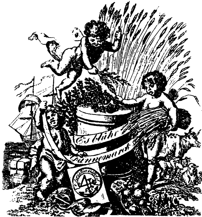
Tobaksvignet fra Spielwerg og Co. i Christiansfeld, ca. 1830–40. Vignetterne havde ikke samme »bevismagt« for toldvæsenet som stemplerne. Af disse ses det oprindelige, godkendt i 1778, nederst på søjlen. Et nyere stempel ses på side 135. Originaler i Rigsarkivet, Kommercekollegiet, industri- og fabriksfaget, journalsag 1840, 419.