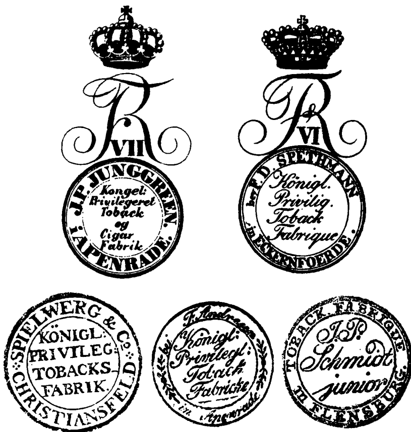
Fabriksstempler for J. P. Junggreens og F. Andresens tobaksfabrikker i Åbenrå, F. D. Spethmanns i Egernførde, Spielweg og Co. i Christiansfeld og J. P. Schmidt jun. i Flensborg. Fabrikkerne egne varer skulle for at hindre toldbedragerier mærkes med disse stempler, som ikke kunne ændres uden Kommercekollegiets tilladelse. Stemplerne, som stammer fra perioden ca. 1820–56, er gengivet i naturlig størrelse. Originaler i Rigsarkivet, Slesvigske Ministerium og Kommercekollegiet.

som aldersgrænse for børns optagelse i bomuldsspinderierne. I Preussen blev regler til beskyttelse af børnene udstedt i 1839 og 1853, og ved forordning af 22. september 1867 blev disse bestemmelser også gældende i Slesvig-Holsten 2 . Af mere varig betydning blev Gewerbeordnung for det nordtyske forbund af 21. juni 1869. Her blev der givet