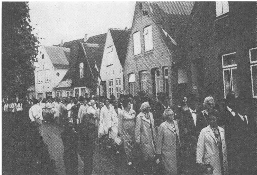
Mandag aften går de festklædte gildesøstre og gildebrødre rundt om kirkegården på deres vej mod gildesalen.

stue med store skinkestykker på tallerknerne og i hænderne. Dertil igen hvidtøl og snaps! Et syn, der efterlod sit indtryk hos mig.