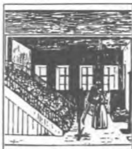
Illustration for bogen om Helsingør, der var udgivet i 1900. Den er tegnet af Paul Hübner, der var arkitekt og bygningshistoriker. Den er tegnet af Paul Hübner, der var arkitekt og bygningshistoriker. Den er tegnet af Paul Hübner, der var arkitekt og bygningshistoriker.

Udgivet af Det sociale Boligselskab med artikler af medarbejdere ved Helsingør Kommunes Museer om boligbyggeri i Helsingør 1885-1985, Hamlets Vænges bygningshistorie samt beboerindrykninger.