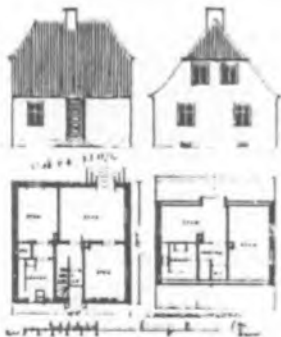
En af Paul Hübners første tegninger til etårshuset i Hamlets Vænge (Hamlets Vænge nr. 15, 16 og 17)

Rigt illustreret værk om Kronborgs riddersal med farvegengivelser af samtlige tilbageværende Kronborg-gobeliner.