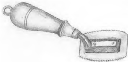
Finersav. Tegn. forf.

Her til sidst, kan jeg, nu hvor vi nærmer os nytåret, hvor man tradi-