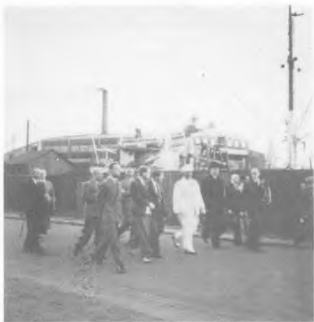
Hermann Göring i Helsingør

både med ærinde til værftet og til de forskellige kulfirmaer på havnen.