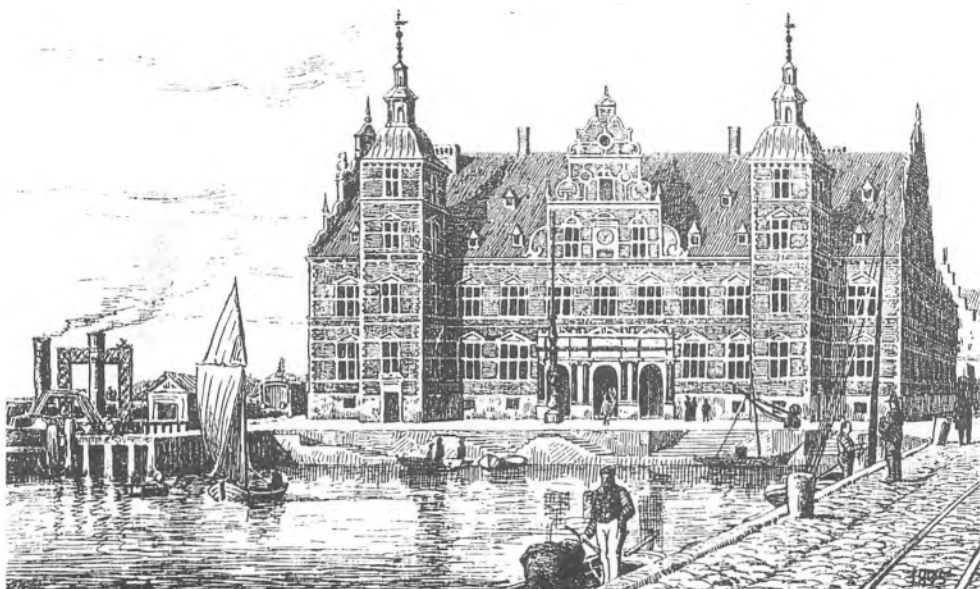
Den ny Banegaard ved Havnen.