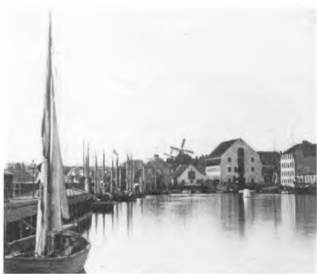
Lille fotografi af havnen fra samme tidspunkt som tegningen.