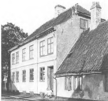
Svingelport 9-11 fotograferet omkring århundredeskiftet.

kunne ende sikkert og godt nede i Svingelport. Det var selvfølgelig strengt forbudt!