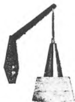
Moderne vægpendel på teaktræsgalge med acryl-skærm og kobbertop kr. 29.50