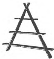
Amagerhylde af teaktræ kr. 20.35