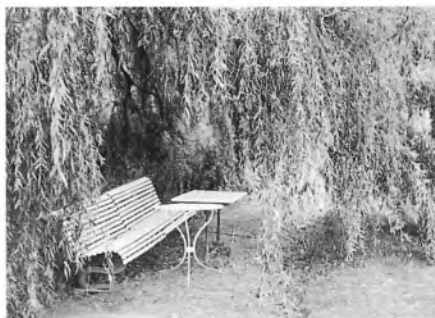
Øverst et stemningsbillede fra Reberbaneparken, der var domineret af piletræer. Nederst ses det gamle hus på Reberbanen, Lundegade 13.