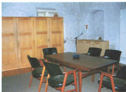
Disse solide egetræsskabe i St. Olai Kirkes sakristi rummer nutidens fornødenheder til »præsternes afbetjening«.

I kirkens gamle regnskabsprotokol fra 1742 på side 372 må kirkens daværende graver nemlig skrive under på at: »Af Sct. Olai kirkes Væрге Hr.