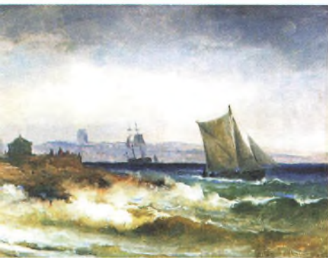
C.F. Sørensen: Helsingørs gamle havnemole. Storm, 1851.

1818, og døde den 24. januar 1879. Han var elev af C.W. Eckersberg, og det danske sømaleri tog jo som bekendt sin begyndelse med denne maler. Men for denne samvittighedsfulde kunstner, der på en tør og nøgtern måde i sine suveræne, stramt komponerede mariner giver unikke eksempler på perspektivisk kunnen, spiller søen en meget underordnet rolle. Den behandles stedmoderligt og stereotypet og bliver kun til for skibenes skyld.