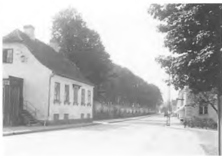
Her er Lappen blevet forsynet med en vejbelægning af beton, og fritrappen er fjernet. (Udateret fotografi af Rudolf Olsen)

At anvende denne belægningsform på Strandvejen blev derfor frarådet af magistraten, som i stedet foreslog cementbeton som belægningsform. Argumentationen overfor byrådet var soleklar: »Naar Magistraten er kommet til dette Resultat, er Grunden hertil i første Række den, at Cementbetonvejen utvivlsomt er den solideste, men desuden frembyder den den Fordel, at der til dens Udførelse saa godt som udelukkende anvendes danske Materialer, og endelig medfører Udførelsen af Cementbetonveje en betydelig større Beskæftigelse af stedlige Arbejdere end Asfaltmakadamisering«.