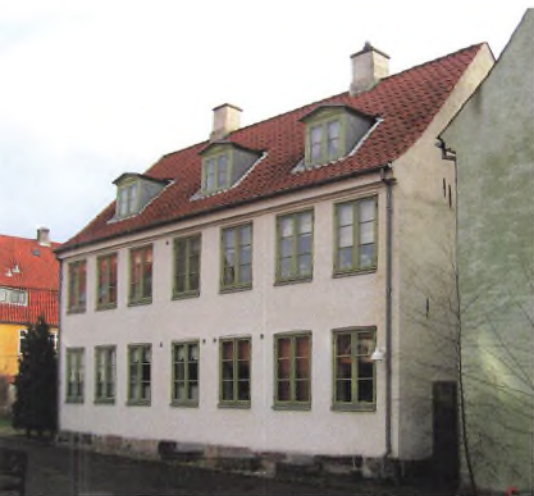
Der findes ingen samtidige eller senere gengivelser af Helsingørs Dampkøkken, der var indrettet i den her viste, stadig eksisterende bagbygning i ejendommen på hjørnet af Stengade og Klostergade. Hovedindgangen skulle have været midt for med en rummelig forstue, hvorfra en trappe førte op til første sal. Her fandtes en større og en mindre spisesal med 12 små borde.