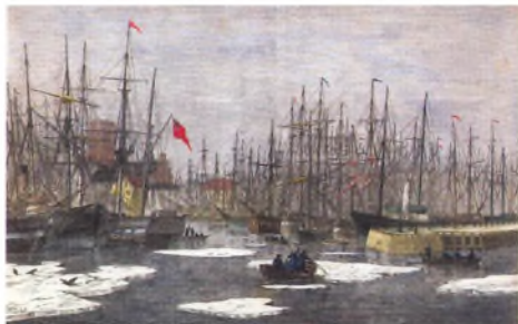
Helsingør Havn fungerede om vinteren som tilflugtshavn. Sundet var dengang frosset næsten hver vinter. Xylografi af Carl Baagøe 1868.

Vinteren dette år var i øvrigt ganske streng, og så sent som i april 1853 måtte politiet på veg-