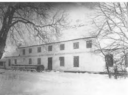
Marianelund Kro.

et ordre til at sætte hesten i stald. Alle kroens folk og gæster stod ved vinduerne for at se det flotte køretøj. Staldmesteren løb efter vognstigen, for at bruden kunne stige ud, men Sidse kom ham i forkøbet; hun tog kjolen op og skrævede op over vognfjælen; derved fik hun vist sine ringede strømpekafter, sin nye klokke og de broderede mamelukker.