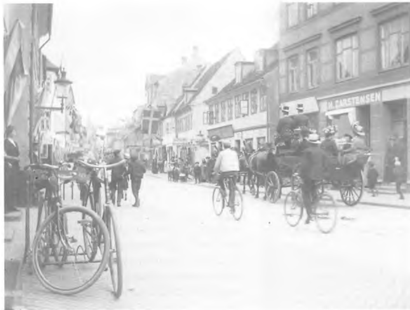
Stengade har altid været et mylder af mennesker og trafik. I 1913 var det så som så med bilerne. Det var stadig hestevogne, cyklister og fodgængere, der indtog gaden, når butikkerne åbnede.

Du kære Helsingør med dit Sund, dit Kronborg, dit Kloster, dine snørklede Gader og dine efeufyldte Gaarde bag Murrækkerne - bliv ved at være gammel og til Glæde og Vederkvælgelse for de mange nær og fjernt fra, der søger din Hygge og Skønhed.