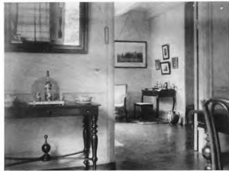
Herover: Krathus 1904 med nyplantede nåletræer og det lave flettede dyrehegn, der er karakteristisk for området. Højre spalte: Interiørbilleder fra Krathus 1916. Herunder: Helene Howitz på altanen 1916.