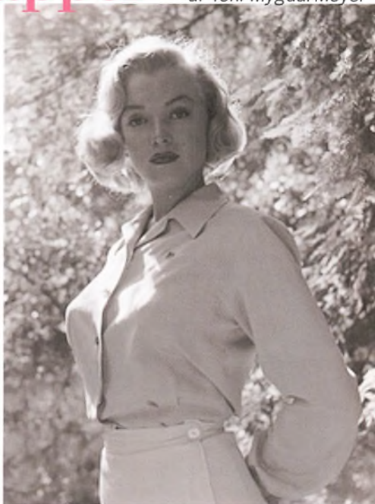
Marilyn Monroe fotograferet i Griffith Park, Los Angeles af Life Magazine fotografen Ed Clark, august 1950. Både bluse og nederdel knappes mod venstre.

Et træk i dragtens kønsdifferentiering, som har holdt sig til nutiden, er overførs-