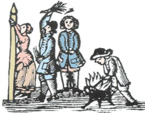
Helsingørs kag (en høj stolpe) stod på torvet ved rådhuset skråt overfor St. Olai Kirke, som det ses på Resens træsnit fra omkring 1660 (t.v.). Ofte var det utungtige kvinder, der måtte lide straffen at blive kagstrøjet, altså bundet til kagen og pisket med ris, som vist på træsnittet herover:

det var sket i hans eget hus 14 dage før Påske i fjor.