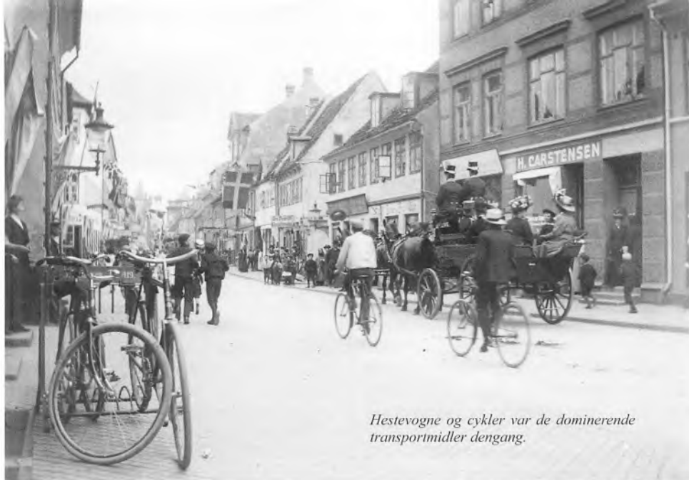
Hestevogne og cykler var de dominerende transportmidler dengang.

med mystik og en gang imellem med sand rædsel, som nu det med hestene. løvrigt kan jeg huske, at jeg var ret betaget af gadens smukke navn. Jeg tror ikke, at der var ret mange af dem, der boede i gaden på den tid, som vidste, hvordan den havde fået sit navn, men der var noget romantisk ved at bo i en gade, hvis navn fik een til at tænke på violer eller den dejligste violinmusik! Senere, da jeg var blevet voksen, fandt jeg ud af at det ikke var blomster eller sød musik, men derimod stinkende dag- og natrenovation, der havde inspireret til navnet. På et tidspunkt i den tidlige middelalder blev byens affald af enhver art kørt op og aflæst på det areal, som i dag udgør byens kirkegård. Når det regnede, løb regnvandet fra byens omegn ned gennem gaderne, og vandløbet, der fandt vej ad Fiolgade, havde først været på besøg i affaldsbunkerne, således at regnvandet, der oprindeligt var farveløst, nu var blevet brunt og ulækkert samtidig med at det forpestede luften i gaden og dens omgivelser. Folk, der på sådanne tidspunkter var nødt til at færdes i gaden, holdt sig for næsen og