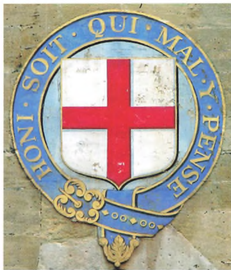
Hosebåndsordenens våben med mottoet »Honi soit qui mal y pense«.

Virkningen deraf var kun i ædel og dydefuld Samdrægtighed at forene og forbinde ædle og dydefulde Fyrsters Sind til Guds Ære, til deres u dødelige Berømmelse og til deres Staters fælles Bedste. I Henseende til Klæderne, da vare de ei alene kostelige, men ogsaa meget klædelige og pyntelige, saaledes at ingen Fyrste havde afslaaet dem, men adskillige havde holdt det for en stor Ære at bære dem; og for heri end mere at tilfredsstille ham (Kongen) havde han (Gesandten) sendt ham et Billede af en Mand, saaledes paaklædt, tillige med Statuternes Brug.«