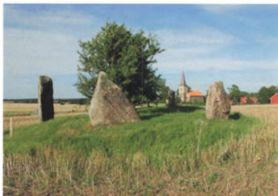
Tullehögen nær Västra Strö nya kyrka.

Thulestenene (Tullehögen i Västre Strö) består af fem rejste sten, hvoraf to af dem er runestene. Teksten på den ene af stenene lyder: »Fader lod hugge denne sten efter Bjørn, som ejede skib med ham«. På den største af stenene kan man læse, at »fader lod hugge dens runer efter sin broder Asser, som fandt døden nordpå i viking«. Efter runernes stil at dømme, stammer monumentet fra 900-tallet.