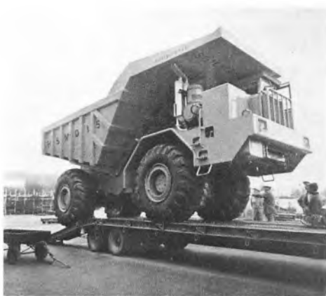
På Herning Messen den 6.-14. september 1969 udstillede værftet det første eksemplar af Soilmaster Dumper HSM-D15. Her køres den op på blokvoegen for at blive fragtet til Herning.

I 1980 solgte Skibsværftet projektet til et firma, Bay & Vinding i Birkerød, som imidlertid lukkede kort efter købet og gik konkurs. Derved blev der sat en brat stopper for dét industrieventyr.