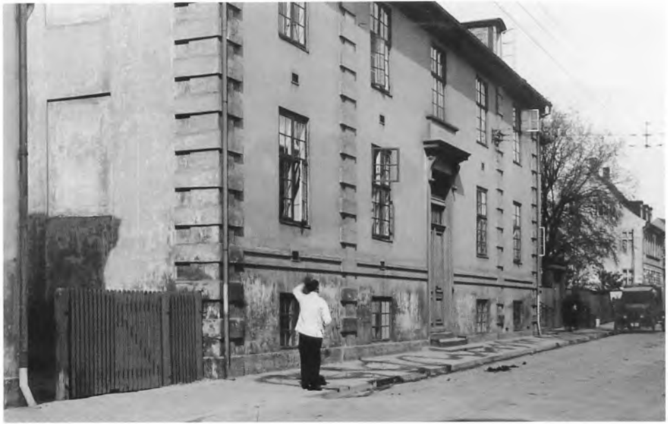
Øresunds og Helsingørs Sygehospital i Fiolgade er opført i 1794-95 efter tegninger af hofbygmester Boye Magens. Bygningen blev overtaget af kommunen i 1859 og blev senere udvidet betydeligt. Fotograf af Hugo Matthiesen 1921.

gjorde hun, samtidig med at hun morede sig over mig og gav mig besked på ikke mere at lave den slags fysiske forsøg.