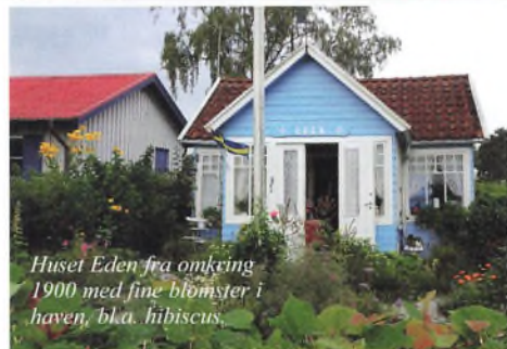
Huset Eden fra omkring 1900 med fine blomster i haven, bl.a. hibiscus.