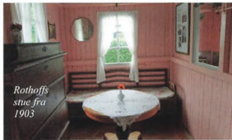
Rothoffs stue fra 1903