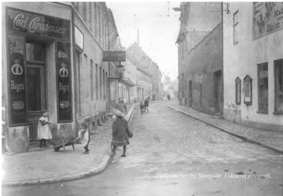
Fiolgade set fra Stengade. Udateret fotografi.