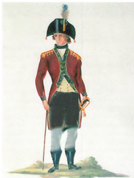
Helsingør Borgerkorpsets Uniform ved Arthurs Corpul.

Når en kræmmer eller en håndværker dengang havde fået sit borgerskab i byen, havde han pligt til at møde på rådstuen, hvor det bestemtes, hvilket våben, han skulle anskaffe sig. I de fleste tilfælde blev det i ældre tid utvivlsomt en hellebard, altså et langskaffet økselignende våben afsluttet