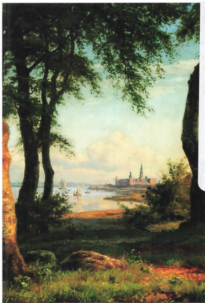
Carsten Henrichsen Kronborg set fra nordvest 1870.