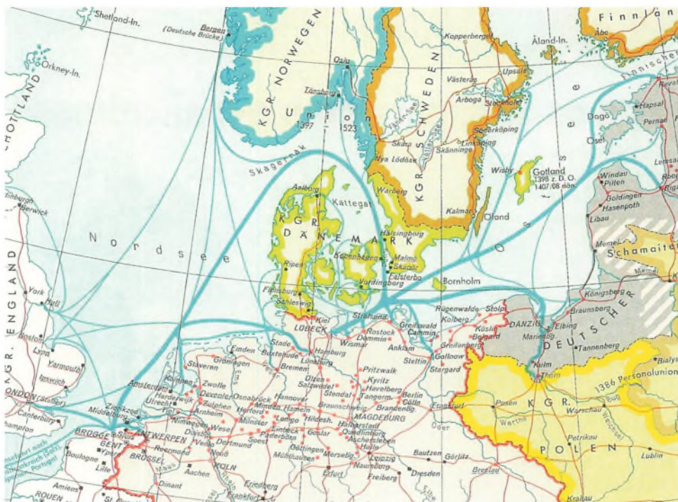
Handelsvejene for 1658