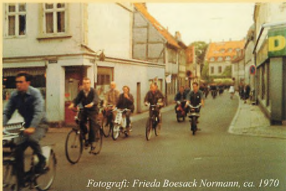
Fotografi: Frieda Boesack Normann, ca. 1970

Der var engang, da Kongensgade var en smal gade, som fire gange om dagen var stærkt befærdet af cyklister og knallerter. Det var dengang Helsingør havde sit eget værft med op til 3000 arbejdere i de helt gode tider.