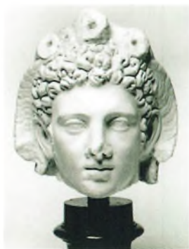
Alexander den Store ca. 270 f.Kr., romersk kopi ca. 100 e.Kr., Nationalmuseet

Foredraget vil præsentere et overblik over, hvad vi egentlig ved om Alexander den Store fra de skriftlige kilder og derfra se nærmere på de mange forskellige Alexander-traditioner og -myter fra middelalderen til i dag; myter og fortællinger, der har været - og er - helt centrale for national selvopfattelse lige fra Island til Iran.