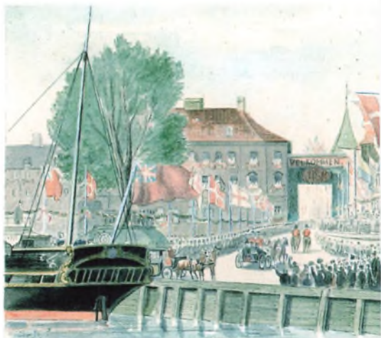
Plantræet var en rest af beplantningen i Øresunds Toldkammers store have og det eneste, der blev bevarret, da den store havneudvidelse i 1859-62 gjorde krav på haven og alle bygninger, da området skulle planeres. Det forklarer, at Stengades østlige ende den dag i dag er hævet over den nuværende Wiibroes Plads, som var der platantræet stod. Man kan godt forestille sig at platanhøjen og pladsen omkring denne har været en yndet tumleplads for byens drenge. Akvarel af Christian Neumann 1864.

Det var derfor ønskeligt, at Publicum og