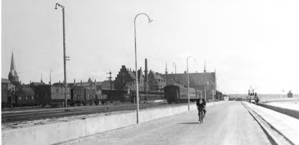
I 1937 indledtes arbejdet med anlæg af en ny Færgevej langs vandet til færgelejerne og med tilslutning til Kongevejen over Trykkerdamsviadukten. Her er den nye vej fotograferet omkring 1939.