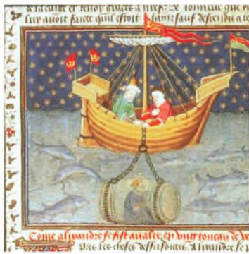
Alexander den Store udforsker havets dybeste del, middelaldermanuskript, British Library