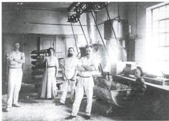
Fællesbageriet blev grundlagt i 1907 som et kooperativt mønsterbrug med, som det ses her, ny teknologi og renskuret personale af begge køn.