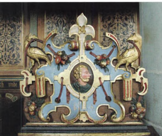
Stolestade fra Kronborg Slotskirke.

De nuværende vinduer i slottet er alle af nyere dato, da de blev udskiftet af Magdahl Nielsen.