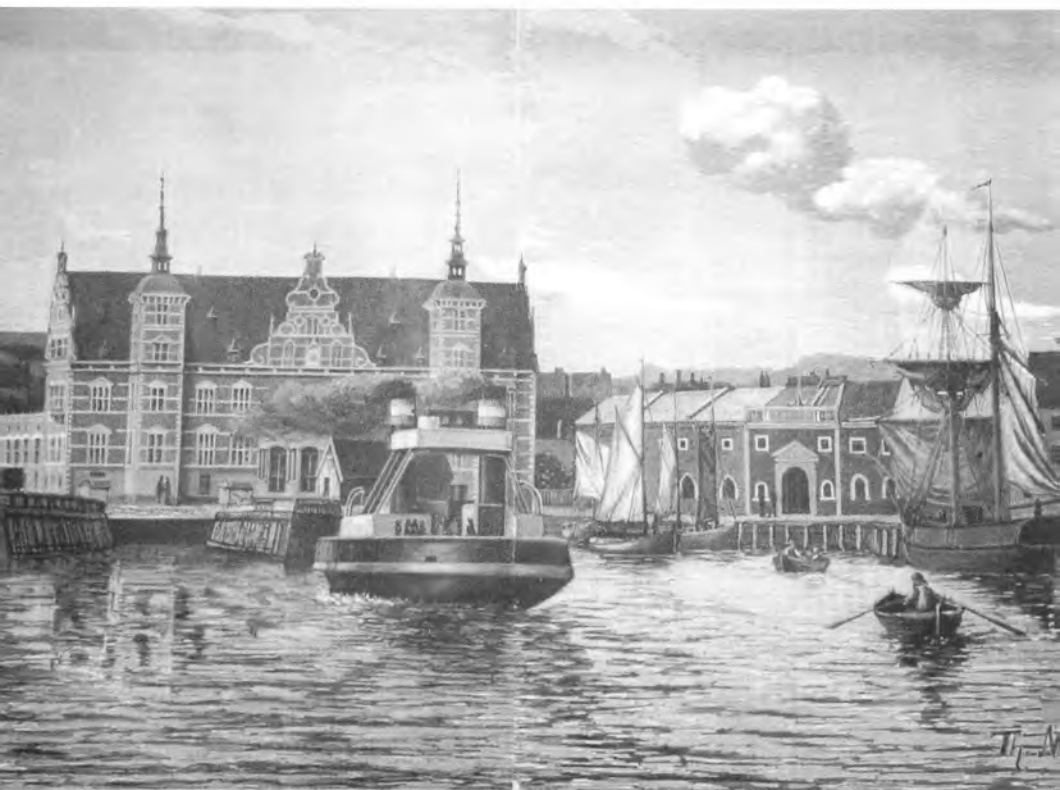
Billedet, som Illustreret Familieblad bragte 9. april 1892, skildrede også toldkammeret, der var blevet indviet fem måneder tidligere. De hvide "ridser", som går vertikalt gennem billedets midte, viser, hvor træstykkerne er blevet limet sammen til én stor trykstok, hvorfra træstikket er blevet trykt. (Træstik i Jørgen Linds samling).

der anbragt runde, polerede Granitsøjler. Naar man kommer ind i Forhallen, bliver man straks forbavset over den Pragt, som møder En. Taget, som er meget højt, er kvadreret og holdt i en mørk Farve og med forgyldte Udsmykninger. Halvvejs oppe strækker sig til begge Sider en pragtfuld Altan, og smukke og storstillede Trapper føre op til begge Sider til Perronerne for Ankomst og Afgang. Ventesalene ere udstyrede med en sjelden Komfort, og Kongeværelserne, som skulle modta-