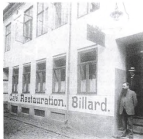
Forsamlingsbygningen i Søstræde. Billedet er fra 1890'erne, hvor kun denne fløj eksisterede.