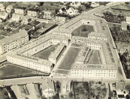
Aldersdomsstiftelsen ved Gurrevej, opført 1919-1922.