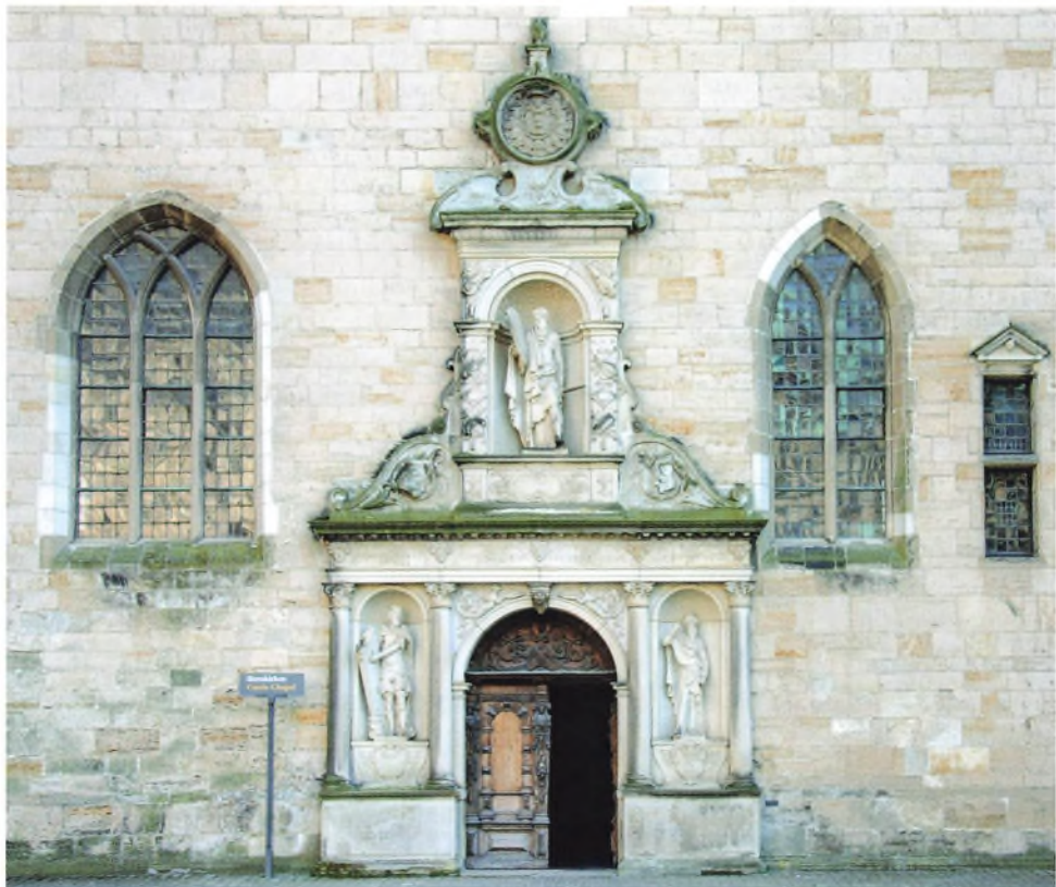
Indgangen til Kronborg Slotskirke.

mælerne over Frederik 1. i Slesvig Domkirke og Christian 3. i Roskilde Domkirke.