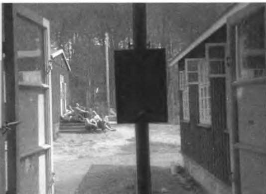
Foto taget ud gennem vinduet i en fangebarak i Horserødlejren på en sådan måde, at fotografen selv er kommet med i det ophængte spejl. Bag barak 15 kunne den tyske Lagerführer ikke se de indsatte.

I Horserødlejren blev den danske forvaltning opretholdt i forbindelse med forplejning, depot og sygebehandling. Den gjorde illegale aktiviteter mulige inden for afspærringen. Indsmugling af forbudte varer var ikke uden risiko, og man skulle være opfindsom og snarrådig. Når tyskerne følte sig generet, provokeret eller opdagede indsmugling af forbudte varer, indførtes sanktioner og stramninger. Tyskerne følte sig f.eks. provokeret af, at modstandsfolk havde vist en propagandafilm i København. De indsatte frydede sig højlydt, hvilket ikke gjorde det bedre. Tyskerne udøvede en form for gengældelse i Horserødlejren på grund af denne episode, fordi de ikke kunne finde de skyldige. Stramningerne bestod i dette tilfælde af stop for løsladelser, som var blevet lovet i anledning af Hitlers fødselsdag. Forbud mod tobaksrygning, brev- og pakkeforbud, forbud mod kortspil, som skulle afleveres, fulgte. Det lykkedes dog at skjule en del. Et enkelt brev kunne dog sendes hjem med en kort oplysning om brev- og pakkeforbudet. Nyheder om krigens gang var så vigtige for de indsatte, at de trods for-