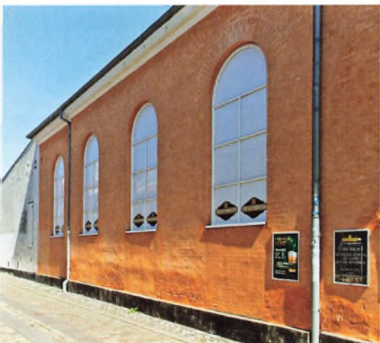
Bygningen i Søstræde i dag.