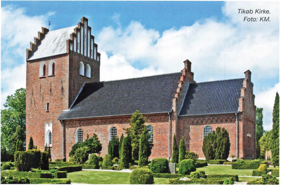
Tikøb Kirke.