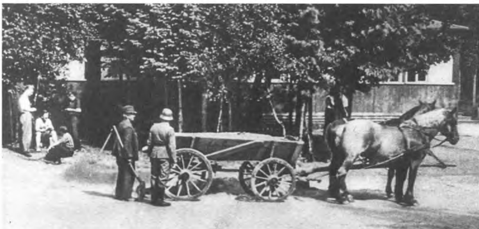
Tysk soldat ved arbejdsvogn i Horserødlejren.