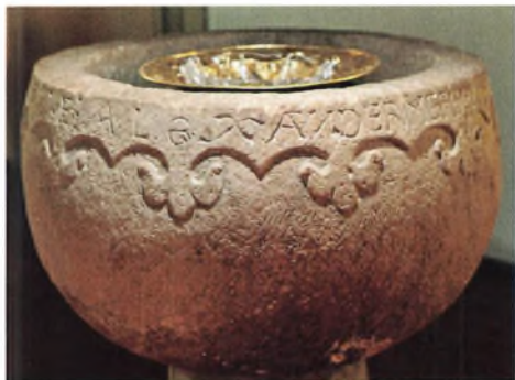
Døbefonten i Fors Kirke.

trisk sving har han undgået at give den store stenblok en stillestående tyngde. På trods af denne markante udformning leder man forgæves efter andre døbefonte eller skulpturer, som på stilistisk grundlag kan tilskrives Alexander.