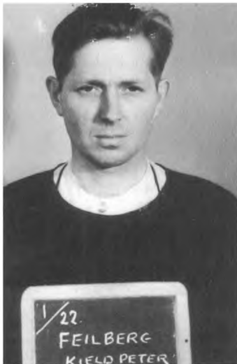
Fangefoto af Kjeld Feilberg.

Kjeld Feilberg blev født d. 29. marts 1914 og døde den 9. september 2004. Han skrev bogen: "Flygtet, fanget og fængslet. Gestapofange K. Feilberg