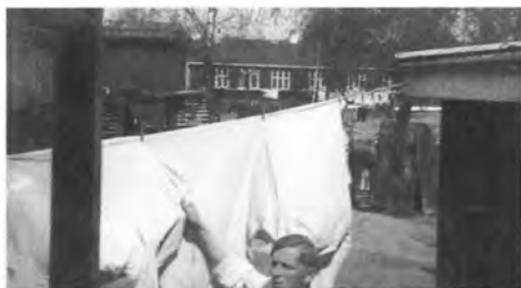
Dyner luftes på tørresnoren.