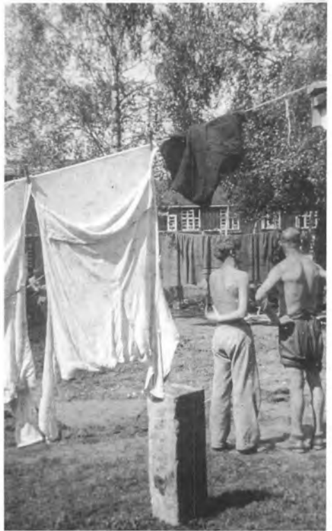
Fanger i Horserødlejren ved tørresnoren. Når tyskerne ikke var i nærheden, var der ret fredeligt i lejren.