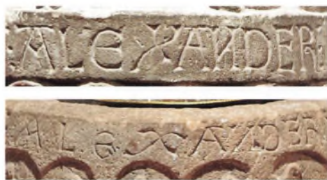
Signaturen på Tikøbfonten øverst, Fors nederst.