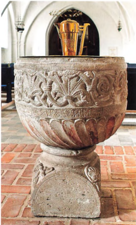
Tikøb Kirkes døbefont.

Den klassiske latins udtryk IN HONOREM er, som det ses på forsidebilledet, i den middelalderlige indskrift blevet til IN ONORE. Tabet af den svage konsonant m i udlyd forekom allerede i det folkelige, latinske sprog, vulgærlatin. Dette tab kendes også fra de romanske sprog, som er udviklet fra latin; 'in onore' er ikke blot middelalderlatin, men også korrekt nutidsitaliensk. I vulgærlatin og middelalderlatin ændredes endelsen -ae til -e og MARIAE dermed til MARIE som også i indskriften.