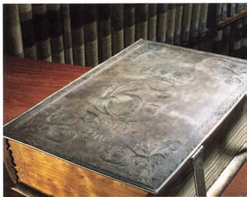
Christian 5.s Danske Lov fra 1683.