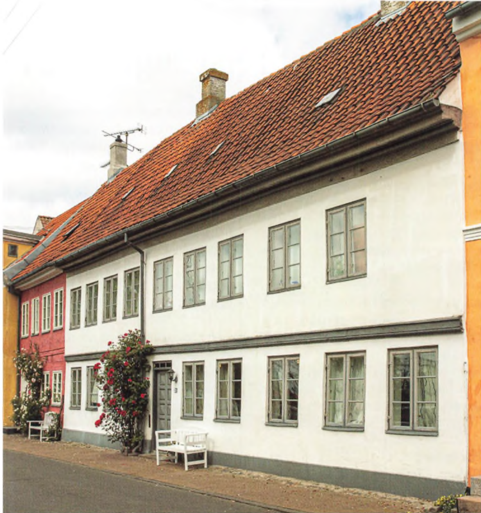
Strandgade 21, hvor "Norske Løve" lå. Ejendommen blev stærkt ombygget omkring 1830.

år derfra til værtshuset Norske Løve (Strandgade 19-21). Her tjente hun forskellige ejere, indtil husets ejer siden Mikkelssdag 1720 (29. september) blev skipper Jacob Jacobsen, og der har hun været siden.