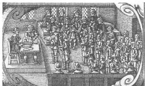
Landsting. I forbindelse med Danske Lov fra 1683 blev der indført otte landsting. Kilde: Danmarks Riges Historie (1896-1907)