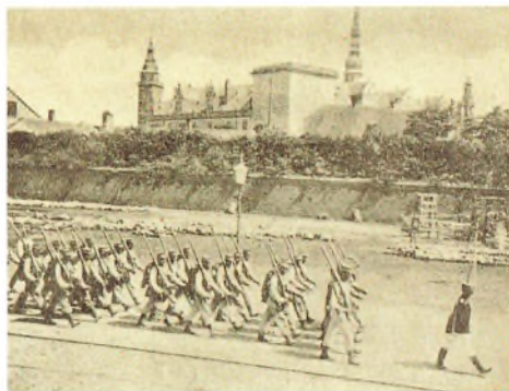
Kronborg anvendtes 1785-1923 primært som kaserne. Billedet her (fra Krig og Fred 29. december 1910) viser tropper af Helsingørs garnison på march.