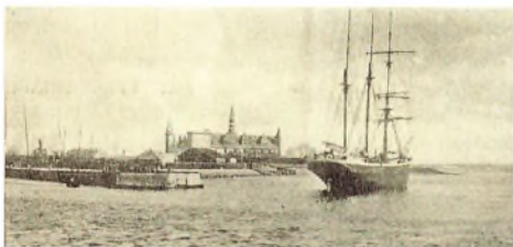
”Kronborg set fra Sundet”. Foto i Krig og Fred 29. december 1910.

Artiklens sidste betragtninger – at man måske kunne finde en ny og anderledes anvendelse for Kronborg – er interessante, for sådan gik det jo. Kun godt fire år efter at artiklen blev offentliggjort, åbnede Handels- og Søfartsmuseet, og det forblev som bekendt på slottet lige indtil 2012.