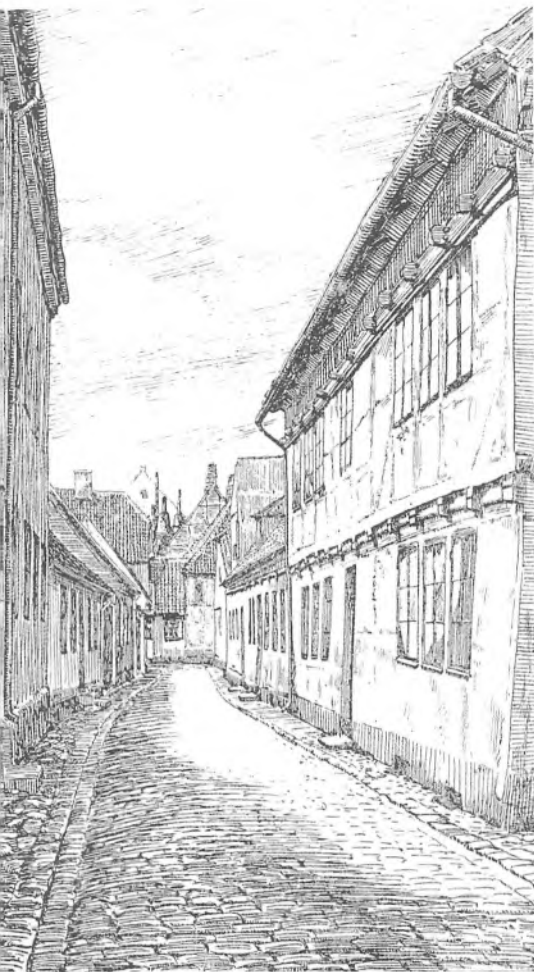
Anna Queens Stræde. Ejendommen til højre er baghuset til "Norske Love".