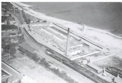
Tretornfabrikken i Helsingør.

Der lader dog til at have været nogle indkøringsproblemer på fabrikken. I august 1935 skrev ”Arbejderbladet” under overskriften Stjæler arbejderne? , at der herskede nogle underlige forhold på Tretorn. Ikke alene blev de ansatte presset af de svenske, fastansatte formandinder til at sætte tempoet urimeligt meget op. Det skete også dagligt, at man sendte folk hjem på grund af materialeangel, så på den måde var der næsten ingen uger, hvor de ansatte opnåede en fuld ugeløn (på ca. 27,50-32 kr.). Der var stor mangel på kontrolure, så de ansatte var nødt til at møde et kvarter før arbejdstids begyndelse for at få stemplet ind til tiden. Og den største hån mod arbejderne: ledelsen kræ-