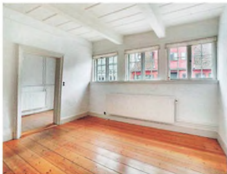
Værelset i gadeniveau.

derstøttende bjælker, som visse steder er meget kraftige.