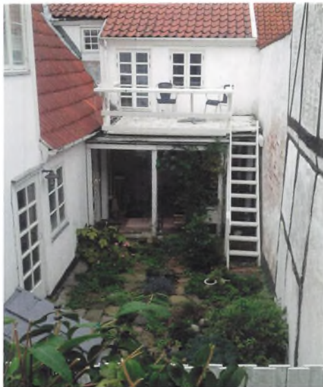
Et kig fra altanen til andre bygninger samt gårdhave.

jet sig ind. Efter restaureringen i 1941 har kommunen lejet ejendommen ud, og som det fremgår af vejvisere til relativt få beboere, som til gengæld har boet der længe. Fra 1943-1994 figurerer en kvindelig lektor i vejviseren og fra 1996 et ægtepar, hvor enken fortsat boede i huset indtil et tidspunkt inden 2013. Flere navne er dog registeret i 1940 og 1960.