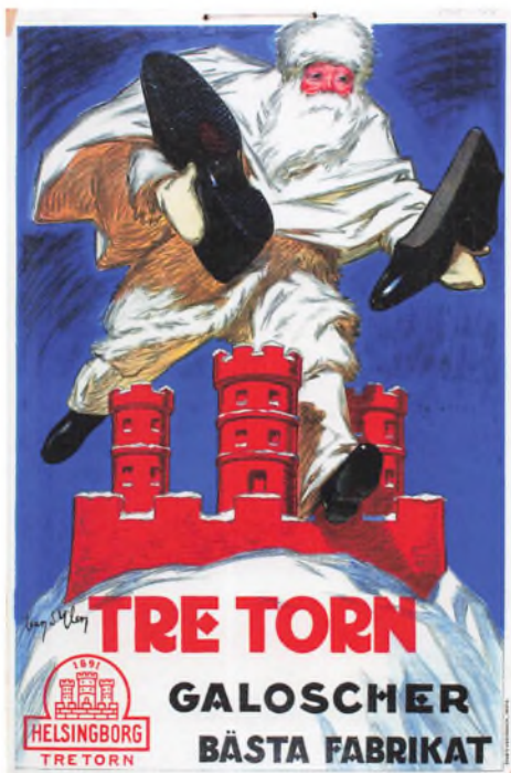
Reklameplakat fra Tretorn. Ingen datering.

sionen beskyttede mange lande deres egen produktion ved at føre protektionistisk handelspolitik. For Dunkers virksomhed var løsningen på at omgå disse handelsrestriktioner at flytte noget af produktionen til de lande, hvor markedet var.