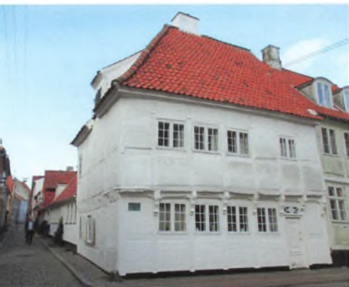
Strandgade 27. Foto: Charlotte Fenger. (CF)