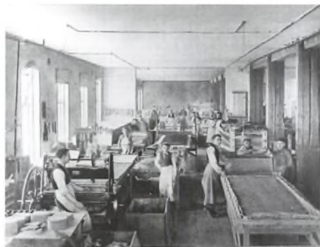
Tilskæring af gummi på fabrikken. Foto fra omkring år 1900.

I 1891 var der omkring 50 ansatte. I 1897 var antallet næsten 400, og det fortsatte med at vokse helt frem til efter 2. verdenskrig.