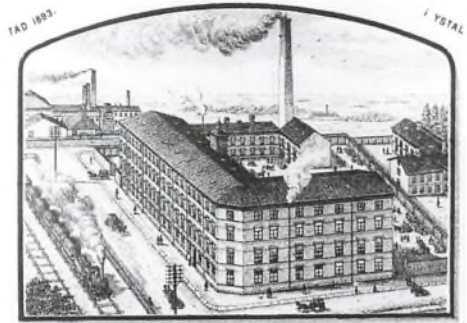
Helsingborgs Gummifabrik 1895.