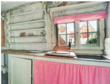
Anretterrum på 1.sal.

Ejendommen har gennem tiden haft mange forskellige ejere og beboere. I året 1682 nævnes værtshuset med navnet ”Peter i Ankerets Datter” (eller ”Peder i Ankerets Datter” eller slet og ret ”Ankeret”), et værtshus som givet har eksisteret i en årrække. Gennem 1700-tallet og 1800-tallet er registret bl.a. en købmand og flere færgemænd og andre som ejere, hvis erhverv ikke er opgivet samt nogle enker, som har overtaget ejendommen efter deres afdøde mænd. Dertil kommer en husmand, en fæstemand og i 1900-tallet inden kommunen overtog ejendommen, endnu en fæstemand, en musiker og en arkitekt. Inden kommunens overtagelse af ejendommen i 1936 har ejendommen formodentlig også været beboet af familier fra jævne og endog fattige kår, som har le-