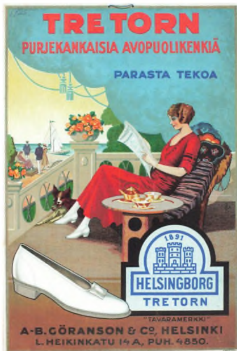
Plakat fra 1925 til det finske marked.

Arbejdernes fagforening havde ikke økonomi til at støtte en langvarig konflikt, så i begyndelsen af juni blev der indgået en aftale, som indebar, at kvinderne i fire uger skulle arbejde til den gamle betaling, men derefter ville få en lønforhøjelse. Kvindernes lønkrav ville påføre virksomheden en udgift på