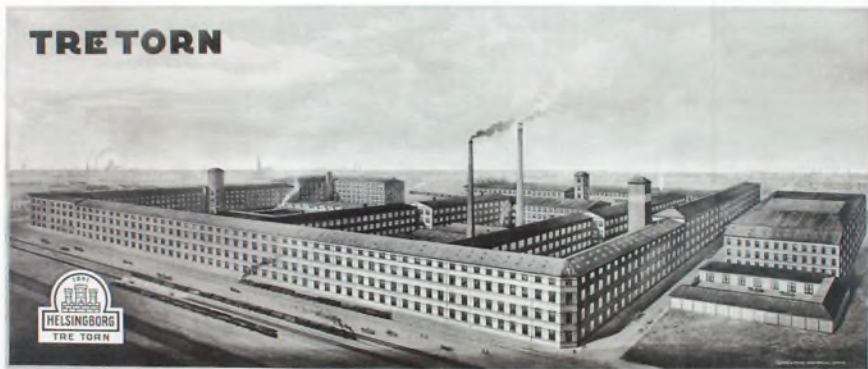
HELSINGBORGS GUMMIFABRIKS AKTIEBOLAG. HELSINGBORG. SWEDEN

Fabriksbygningerne, da virksomheden var størst. Foto fra 1950'erne.