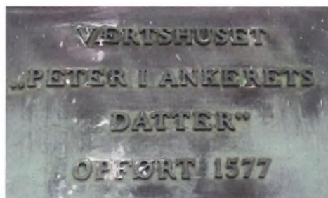
"Peter i Ankerets Datter".

Årene gik, og en beslutning skulle tages. I begyndelsen af 2019 lod kommunen så ejendommen sætte til salg, men uden resultat. Den blev atter udbudt til salg i efteråret 2019 med åbent hus flere gange, og det gav en enestående mulighed for at se ejendommen indefra. I 2013 var den offentlige vurdering på 980.000 kr., hvoraf de 711.300 kr. udgjorde grundværdien. Salgsprisen i efteråret 2019 på 2.350.000 kr. er ganske tankevækkende sammenholdt med beløbet på 6.000 kr., som kommunen overtog ejendommen for i 1936.