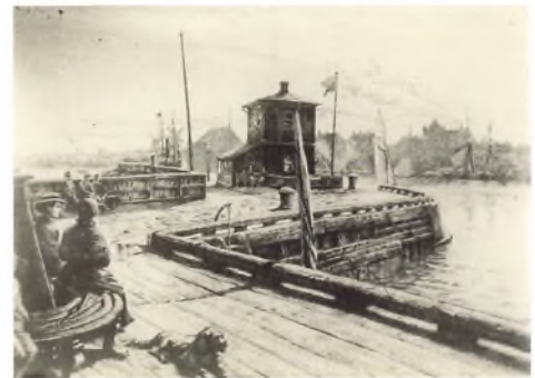
Helsingør Havn's søndre havnemole med Karantænehuset. Postkort efter radering af Peter Tom-Petersen. 1901.

Men en situation som i 2020 med Covid-19 pandemi har ingen haft fantasi til at forestille sig.