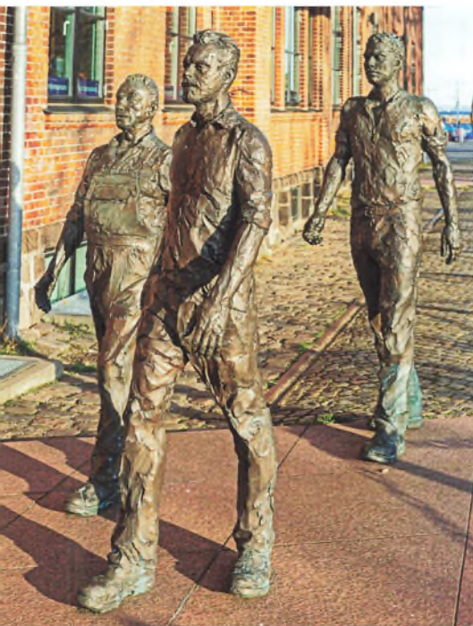
Skulpturgruppen "Værftsarbejderne", som er opstillet foran den gamle indgang til værftet. Gruppen er udført af billedhuggeren Hans Pauli Olsen og opstillet i 2014.