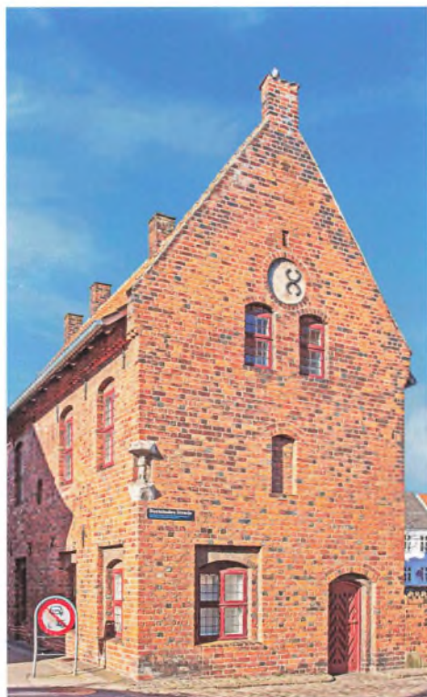
Karmeliterhuset, hvor Helsingør Bymuseum i dag ligger.

Hvis vi sammenligner denne lille uvidenskabelige undersøgelse med indbetalingen af den skat som kongen i sin nåde havde pålagt byen samme år, så finder vi at der i de nævnte fire fjerdinger i året 1630 nævnes 743 betalende borgere. Nu må vi huske på, at