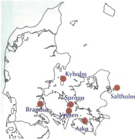
De planlagte seks karantænestationer i Danmark 1709.

passagerer og gods fra ud- og indland. Ved tvivl henvistes til nærmeste karantænestation, hvor syge blev indlagt på lazaretterne.