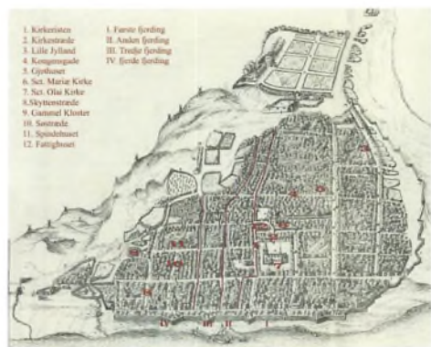
Kort fra Resens Atlas over Helsingør by før 1660, med angivelse af byens 4 fjerdinge.