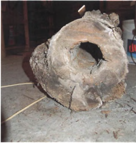
Da en af mine venner gravede ud til kældere i sit nybyggede hus på Rønnebær Allé, stødte han på denne gamle vandledning.