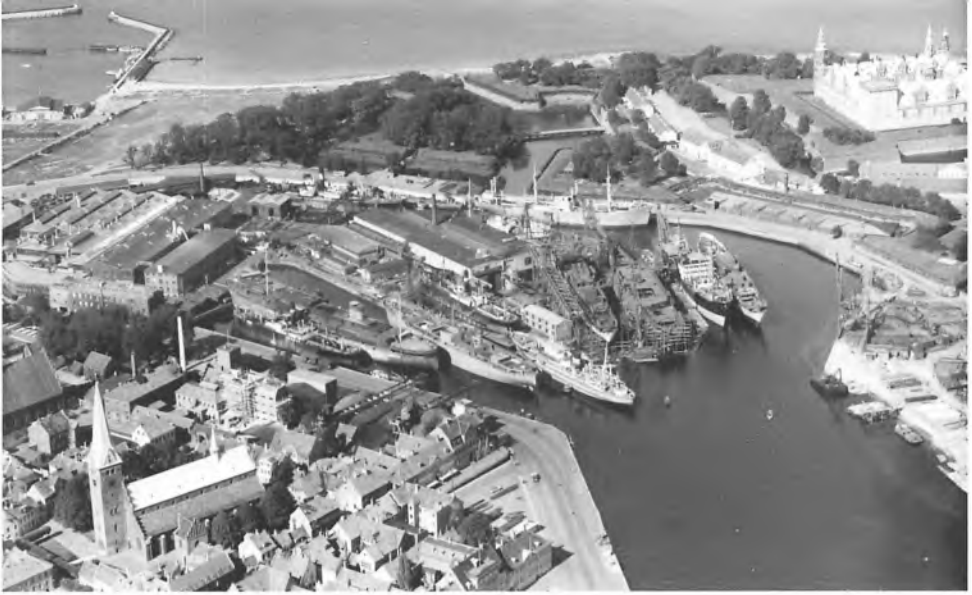
Luftfoto af Helsingør Skibsværft fra 1947.

dan påvirker det fx tidligere værftsansattes erindringer, at et interview med dem foregår i de tidligere værftshaller? Vil mødet med en arbejdsplads og en krop, der pludselig husker qua lugte, lyde eller lys betyde nye eller andre fortællinger? Hvad gør det ved erindringer, når et interview foregår hen over et fotoalbum? Betyder det, at helt andre erindringer pludselig dukker op? Eller hvad sker der, når man er flere, der husker sammen, fx tidligere kolleger eller familier? Med andre ord bliver det en del af projektet at undersøge, om disse forskellige scenarier får de tidligere værftsansatte til at huske mere eller andet eller på en anden måde?