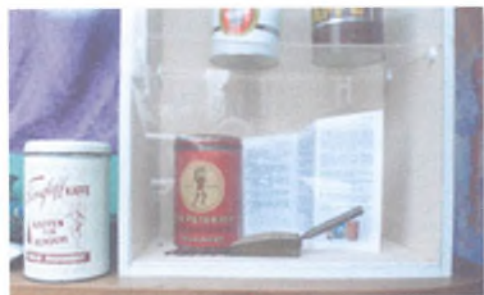
Billedkvaliteten skyldes foto er taget gennem butiksrude og montre

Hele ideen har været at få bysbørnen ud i byen og opleve byen på en anderledes og spændende måde.