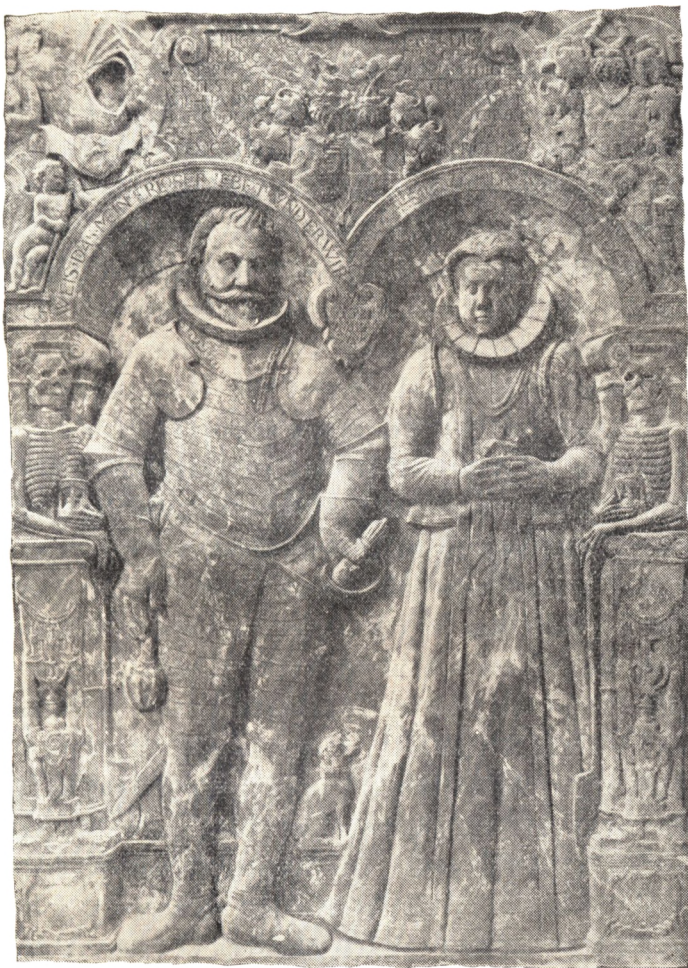
Caspar Markdaners og Sophie Oldelands Ligsten.