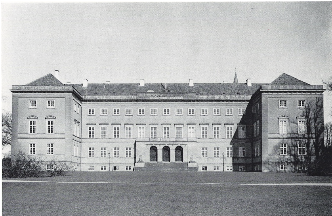
Peder Malling's Akademibygning i Sorø. Foto: Niels Elswing 1954 (Nationalmuseet).