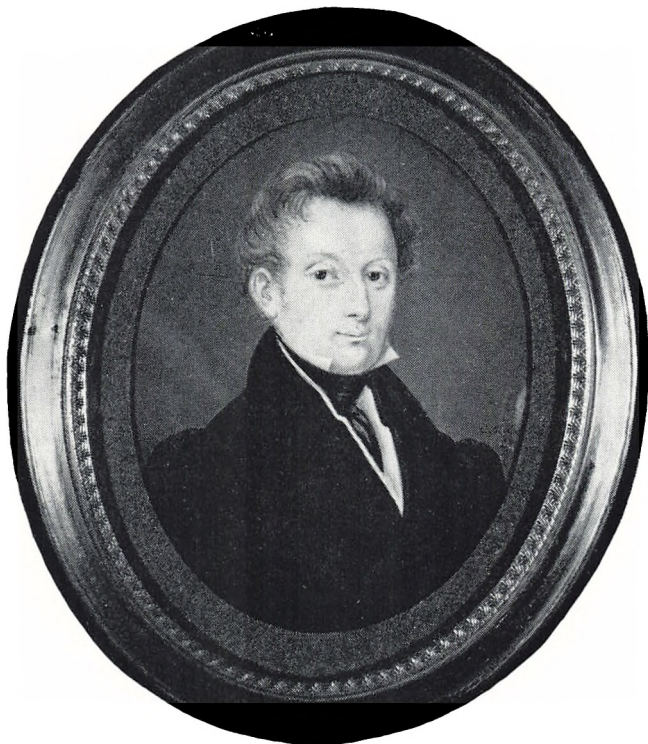
Carl Bagger (1807–1846). Miniature af Christian Petersen 1828 (Frederiksborgmuseet).