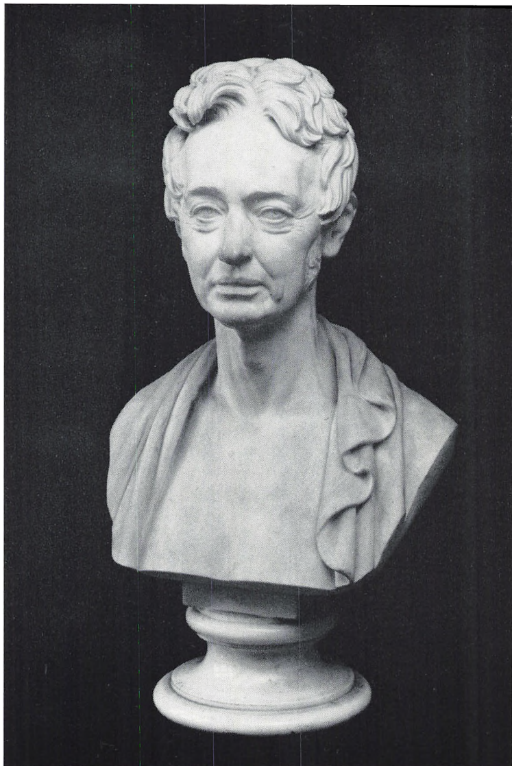
Carsten Hauch (1790-1872). Marmorbuste af H. V. Bissen 1858 (Frederiksborgmuseet).