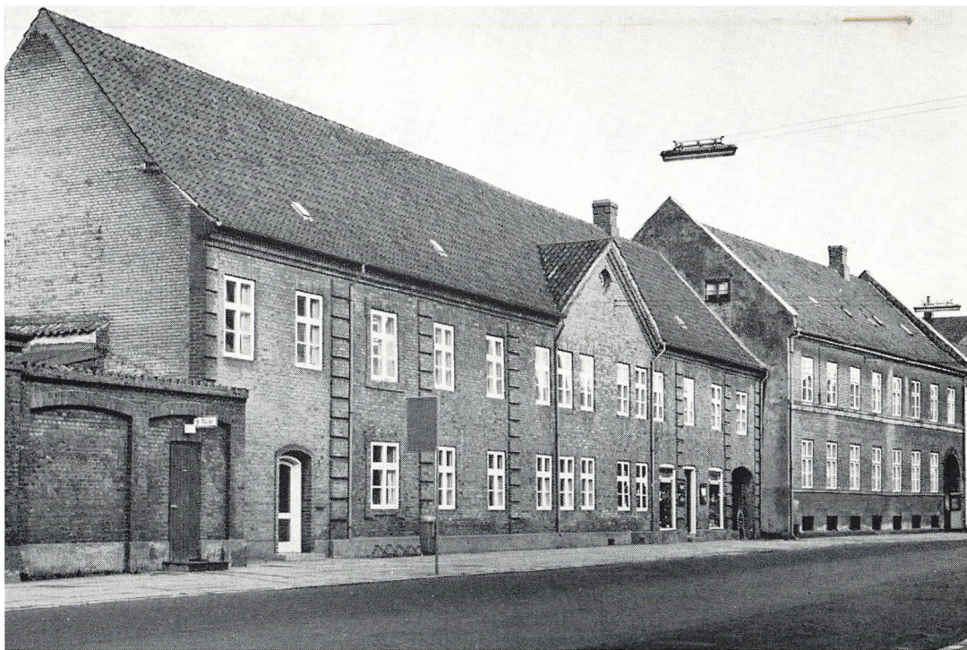
»Herrernes Gaard« (til venstre) i Sorø. Foto: Jytte Hergaard (Sorø) 1983.