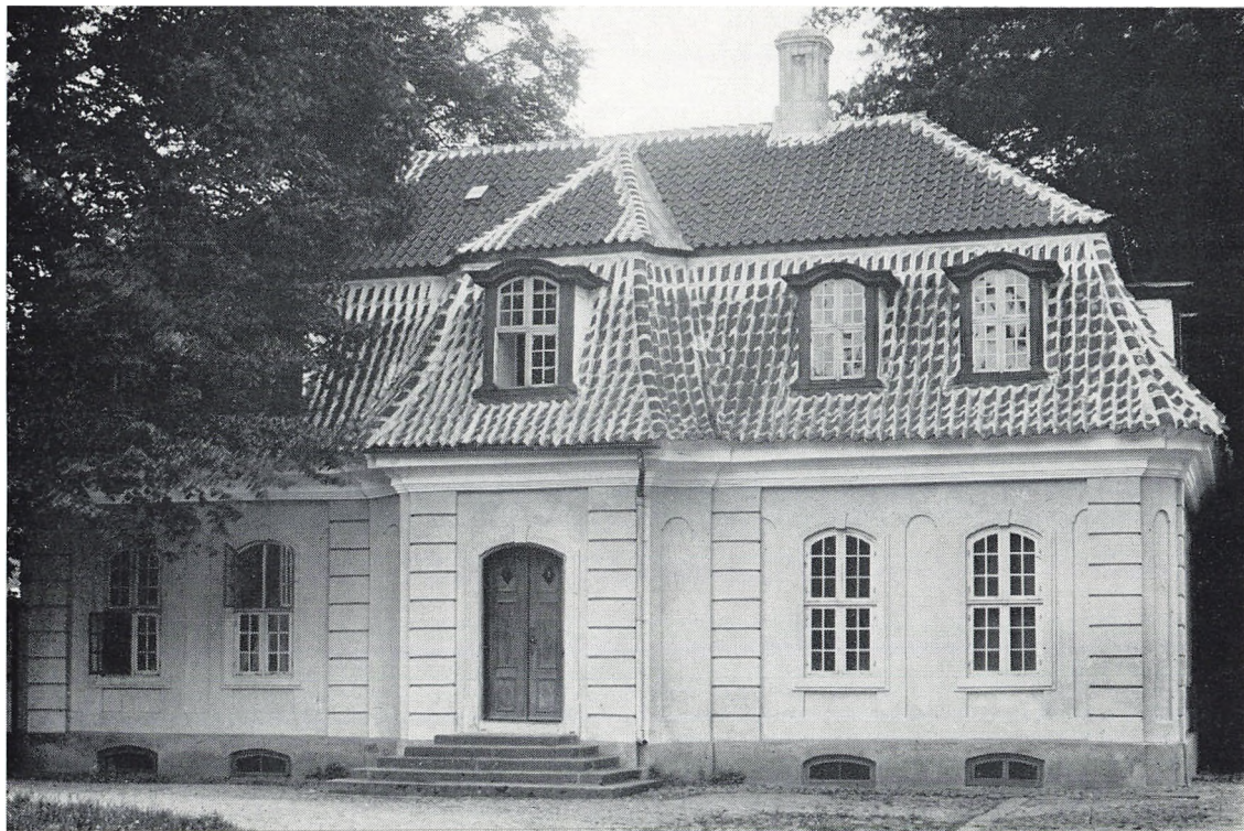
»Ingemanns Hus« i Sorø.