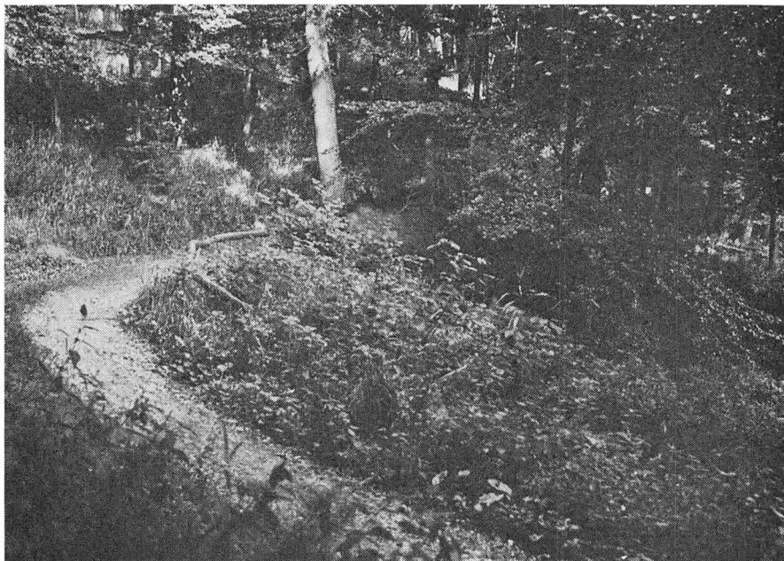
Parti fra »Gendarmstien« i Kruså skov, 1967.