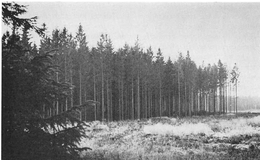
Gammel granskov i Bommerlund før stormene i 1967.