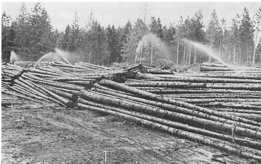
Tømmerstakke i Frøslev skov med sprinkleranlæg. I alt oplagredes på denne måde 40.000 m 3 tømmer efter stormene i 1967.

– i hvert fald efter nogen tid forløb. Et stor prisfald indtraf naturligvis straks efter stormene, og uheldigvis faldt dette tidspunkt sammen med en generel afdæmpning af markedet, hvilket yderligere gjorde situationen alvorlig for skovejerne.