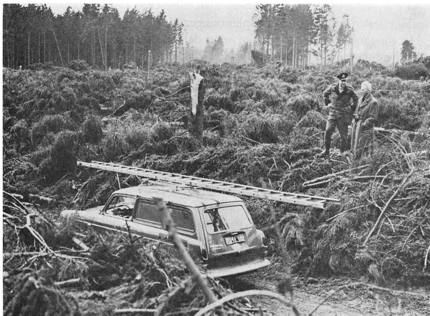
Efter stormen 23. februar 1967. Denne dag væltede 60.000 træer i Frøslev skov.

Kron- og dåvildt er, som »Bogen om Bov sogn« fra 1939 også siger var tilfældet dengang, jævnlige strejfgæster i vore skove. I 1958 blev en 10-ender kronhjort skudt i Frøslev skov, hvor den gjorde en del skade ved at skrælle barken af træerne. I Bommerlund sås i efteråret 1966 gennem længere tid en hvid dåhjort. Det kan meget vel tænkes, at en mindre hjortebestand kan sætte sig fast i området ad åre, når de nye tykninger gror til, og der falder mere ro over skovene.