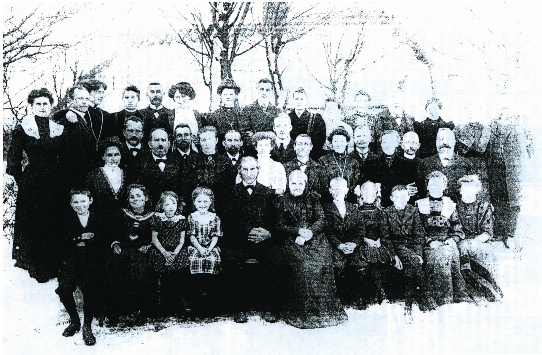
GULDBRYLLUP I SLANGERUP