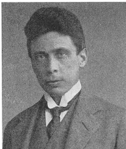
Den unge præst

Vi var altså mødtes herude og kunne tage trådene op fra en fælles ungdom; vi forstod hinanden. Vel var afstandene store mellem vore præstegårde, 10–15–20 km, men de blev ofte overvundne, når der var glæder eller sorger i hjem og arbejde at dele. Som sagt, folk konstaterede dette og var tilfredse med dette usædvanlige gode forhold imellem os.