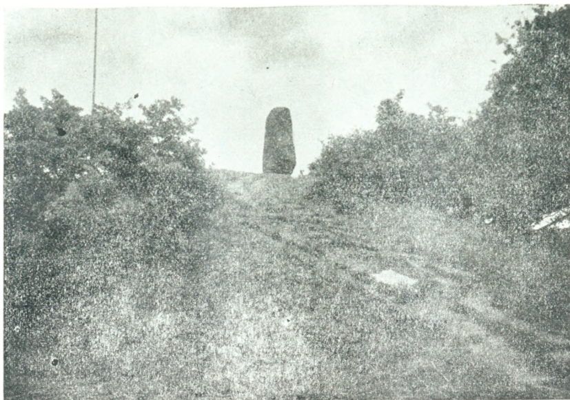
Lyshøj med Blicherstenen