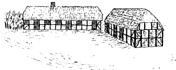
Slægtsgaarden før Flytningen i 1851.

Stuehuset laa i Øst—Vest i Nordsiden og Udhuset i Nord—Syd i Østsiden af Gaardspladsen. Stuehuset var ret langt, og nogle Fag af den blev benyttet som Udhus.