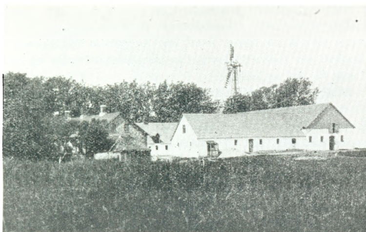
Slægtsgården i 1940.

Sydsiden af Stuehuset er saaledes muret op af gule Mursten fra en Vinkælder, der blev nedbrudt i Lejren. Vinduer og Døre er, ligesom meget af det øvrige Træværk, fremstillet af opsa- vet Tømmer derfra. Tagkonstruktion og Bjælkelag er øget og samlet mange Steder, for at det forhaanden værende Materiale kunde benyttes.