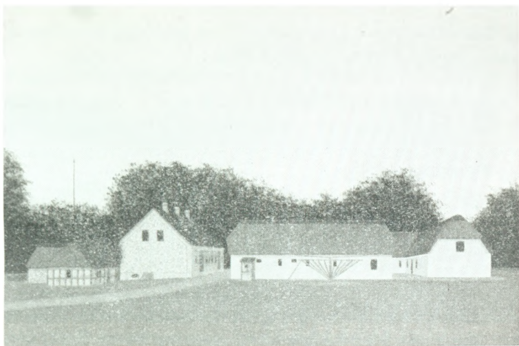
Gaarden omkring Aarhundredskiftet.

Øst for Gaarden i en Skrænt ved den saakaldte Gammeltoft Mose blev fundet Mergel, der maaske ikke var af særlig god Kvalitet, men der er dog i Aarenes Løb kørt utallige Læs paa Gaardens Marker.