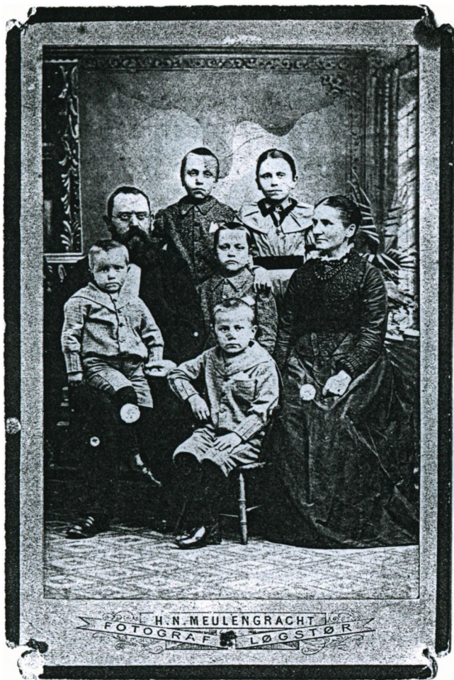
H. N. MEULENGRACHT FOTOGRAF LØGSTØR