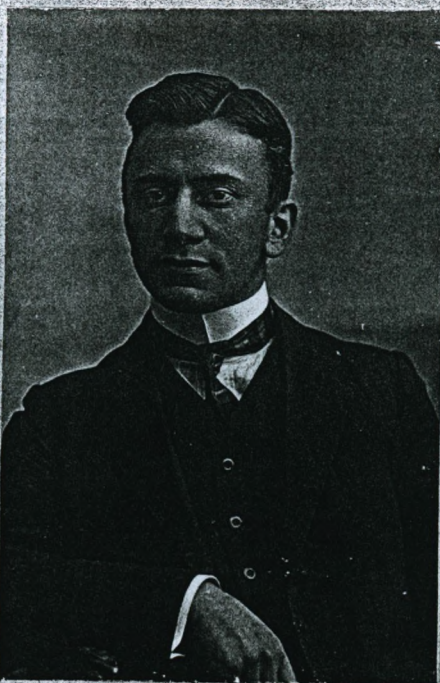
Atelier Français VIMMELSKAFET 38 KØBENHAVN