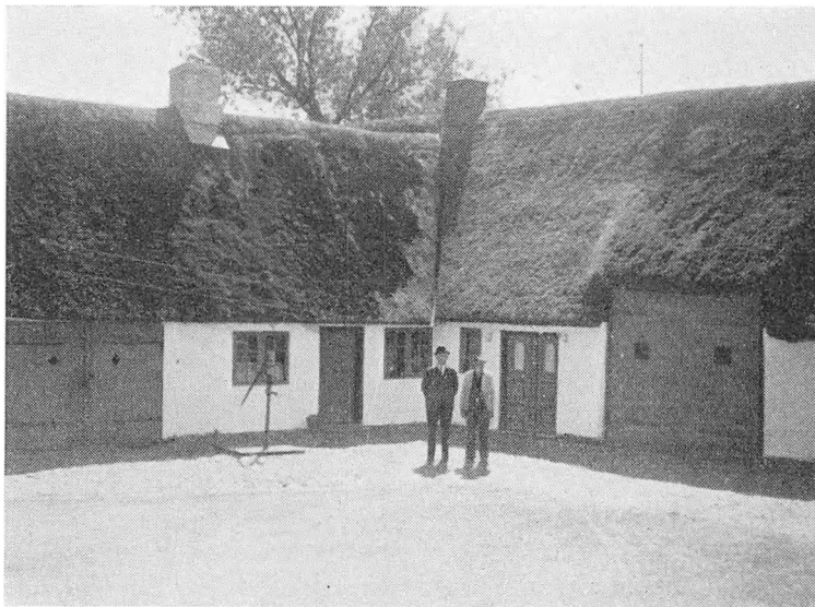
Den gamle gård i Nørre Hjarup

Nationalmuseet har udbedt sig en prøve af det fundne pulver, som også er blevet dem tilstillet, men det er endnu ikke lykkedes dem at nå frem til en analyse deraf.