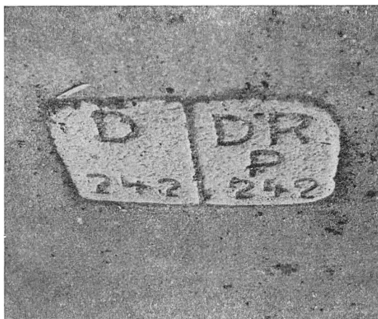
Grænsesten i Rudbøl

skulle grænsen fortsætte i zoneskellet d. v. s. langs kærDIGETS nordrand. Kun i Rudbøl By og i Rudbøl Sø befandt grænselinien sig i 2den zone, og den var her indenfor arealer, der skulle deles, inden linien påny kunne komme i forbindelse med den fastlagte zonegrænse. Spørgsmålet var blot: Hvorledes skulle delingen ske? Og det gav anledning til mange overvejelser, ikke mindst fordi der her var tale om et forholdsvis tæt bebygget område, idet alle ejendomme fra gammel tid var placeret langs en landsbygade, der oprindeligt var et dige. Beboernes nationale opfattelse var tilmed forskellig, og jord-