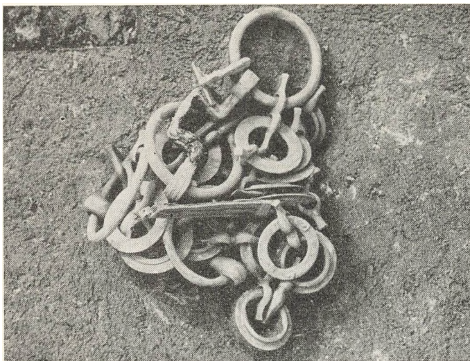
Ejsbøl mose. To bidslers med broncekæder, foroven ligger den U-formede mile.