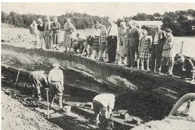
Fra Ejsbøludgravningen 1957. Bag de tre udgravere ligger oldsagerne på deres plads på den flade, der er under udgravning. I den lodrette jordvæg ses de lyse sandlag, som tid efter anden er skyllet ud i søen, til venstre i billedet er ind imod land. Der var næsten altid interesserede tilskuere.