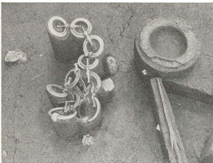
Ejsbøl mose. Ved siden af et bidsel med tilhørende bronzekæder ligger en skjoldbule og en spydspids.