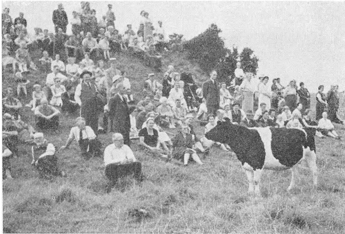
Egnsvandringerne vinder større og større tilslutning. Her lytter en interesseret, sortbroget ko til magister H. Stiesdahls foredrag om Tovskov voldsted.