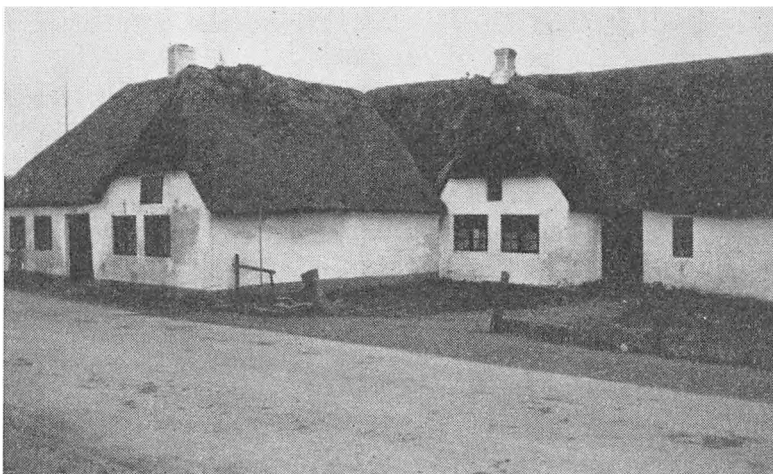
Gamle huse i Løjt Kirkeby.

den genpart af kirkebøgerne, som han førte, for at få den sammenlignet. Han lod bøgerne ligge i præstegården, og dermed brændte begge sæt kirkebøger fra tiden omkring 1840–1867, ligeledes må en kirkebog fra før 1763 være gået tabt ved denne brand.