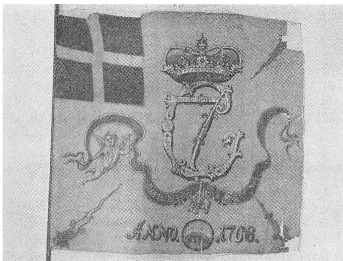
Borgervæbningens fane med Christian VII's navnetræk. Fanen bærer årstallet 1766 og er sikkert anskaffet samtidig med den grønne gardes oprettelse.