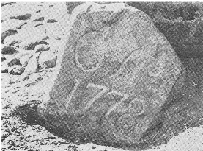
Stenen ved kirkepladsen (se fodnote)