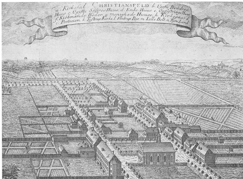
Christiansfeld, efter stik fra 1781.

skomakerhåndverket. Den 1. juni 2) fikk jeg den nåde at jeg fikk tillatelse til å bli her, førenn jeg ba om det for alvor. Jeg må rett si det var nåde, da andre derimot med alvor har bedt og har ei fått tillatelse.«