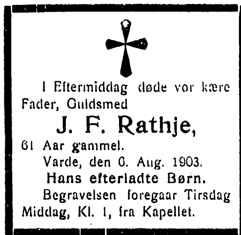
Fig. 72. Annonce i Ribe Amts-Tidende den 8. august 1903.