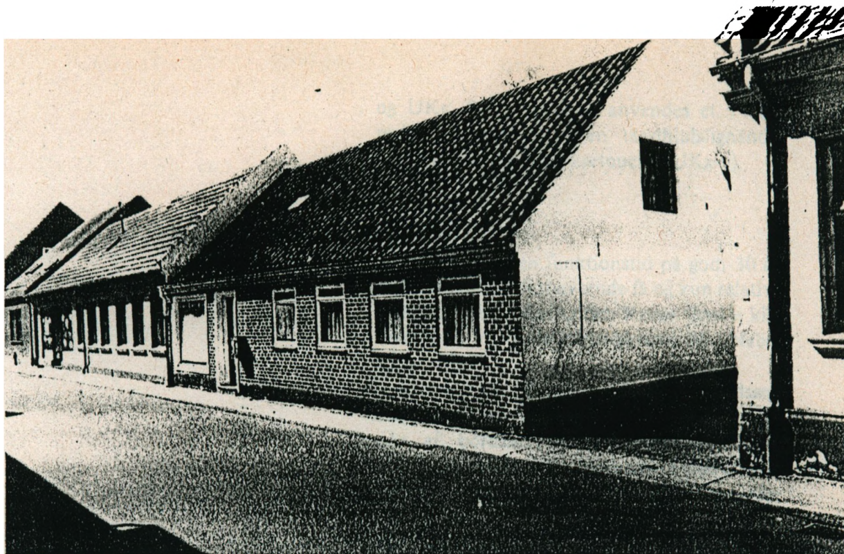
Fig. 40. Guldsmed Ulrich Adolph Kruses hus i Nørregade. Oprindeligt med 8 vinduesfag, senere ændret til 4 fag vinduer samt dør og stor butiksrude. Huset nedrevet 1983.

ses på den anden side også selv at låne penge ud. 15 I 1818 forøger han ved tilkøb ejendommens eng- og moscarealer. 16