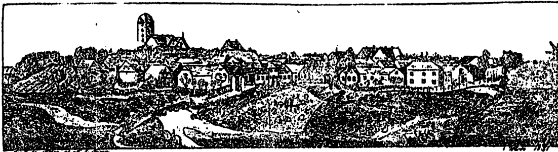
VARDE 1 1891