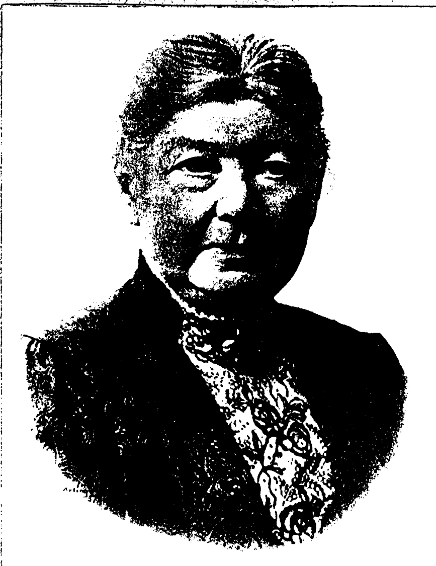
Berstemors var en aristokratisk og uhyrlig dame