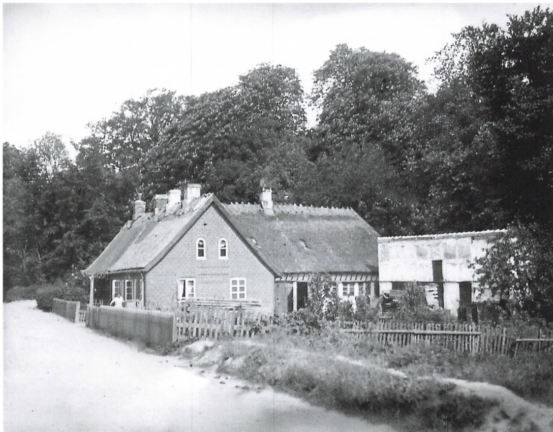
Stutterivej med Brammersgave, ca. 1930.