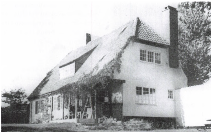
Ældre foto af huset set fra havesiden.