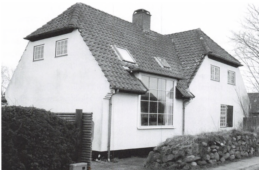
Huset set fra vejen. Foto: Henrik Selsøe Sørensen, 2017.