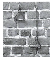
De to liner på Klokketårnets nordside.

Ved en bestemt lejlighed havde jeg dog undladt at tage mad med. Det var i 1976, da juleaften faldt på en fredag, min vagtdag. En kollega havde fortalt, at "fagforeningen altid sørgede for god forplejning juleaften". Da jeg mødte, stod der da også en julekurv. Alligevel skuffede indholdet lidt: en flaske rødvin, en flaske hvidvin, 20 Prince og en æske fyldte chokolader fra Anthon Berg.