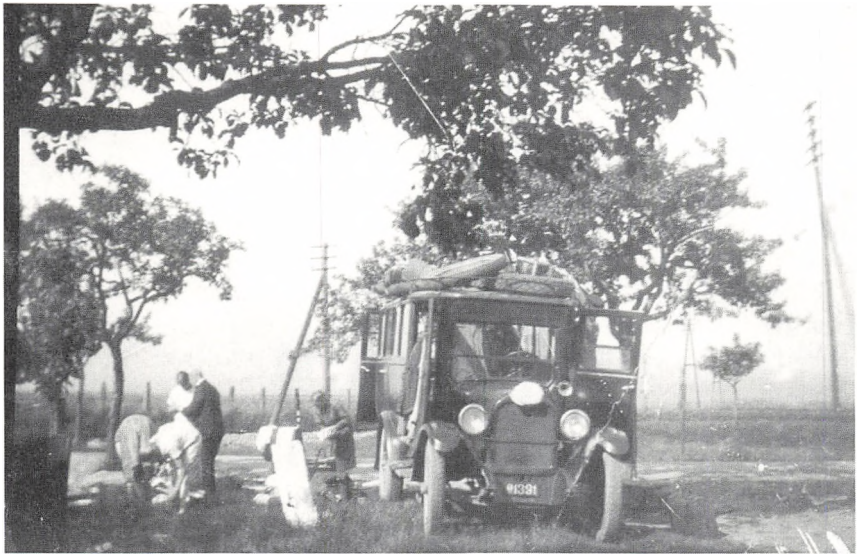
Billede fra Tysklandsturen, hvor vi har gjort holdt ved vejkannten. Kort tid efter billedet blev taget, blev vi skældt ud af en vred tysk kone, der var sur over vores rastested.