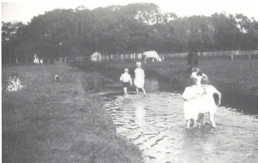
Badende Skjernbørn ved Kirkeåen. Billedet er et amatørfoto taget af Grønlund ca. 1920.

kakkelovne både i butik, og i lejligheden. Peder havde også sit eget værelse. Jeg delte soveværelse med min mor, far, og tre søstre. Nå, det tænkte jeg nu ikke meget over dengang, vi havde det da hyggeligt og rart. Jeg havde da far og mor. Peder mistede sin mor, året efter vi kom i skolen. Peder's far var en meget rar mand, han havde tidligere været mejeribestyrer, men stod nu for driften af El-værket, og han var også forstander for søndagsskolen. Bag huset havde de en dejlig have med græsplæne, og forneden i haven ud mod banen var der store træer, som vi kunne klatre i.