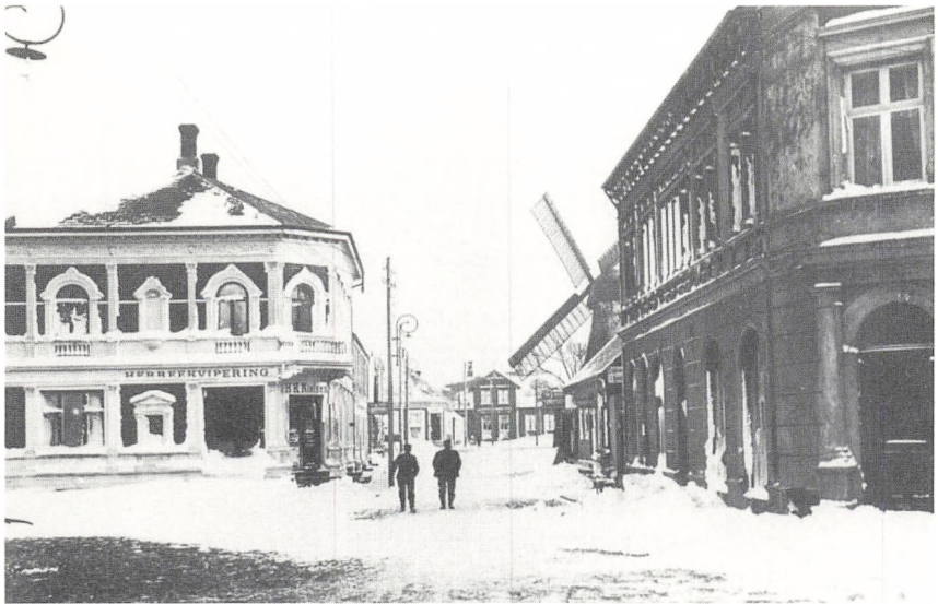
Vinterbillede fra Jernbanegade i Skjern. Billedet er fra 1908, men vinterstemningen er ligesom jeg kan erindre den 10 år senere under den hårde vinter 1918.