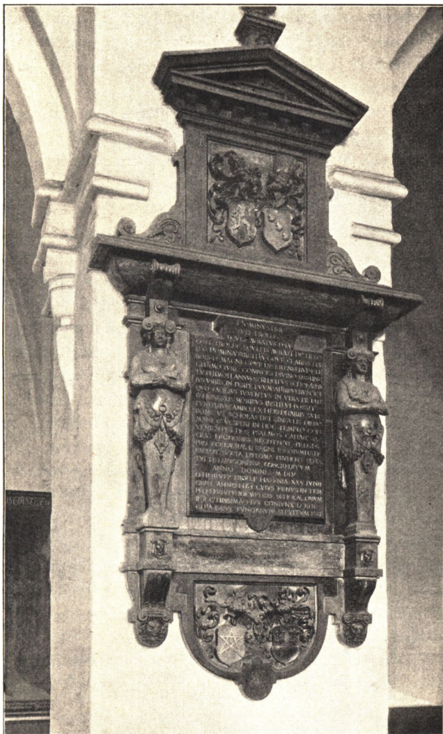
Tavle til minde om Herluf Trolles og Birgitte Gøjes skolelegat, opsat 1568.