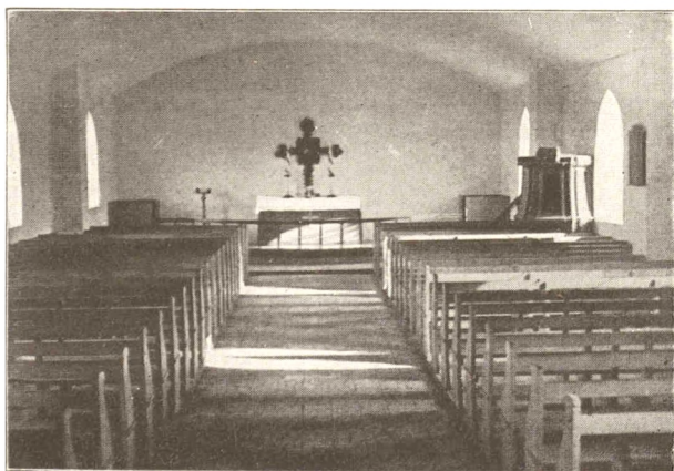
Nazarethkirken i Ryslinge. (1866).