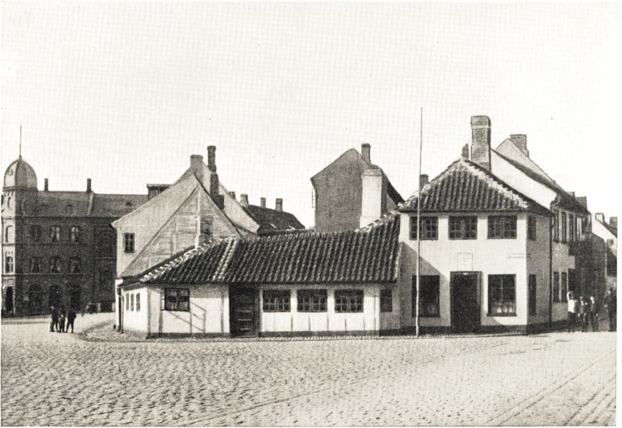
Parti af Klingenberg (med Torvehallen)