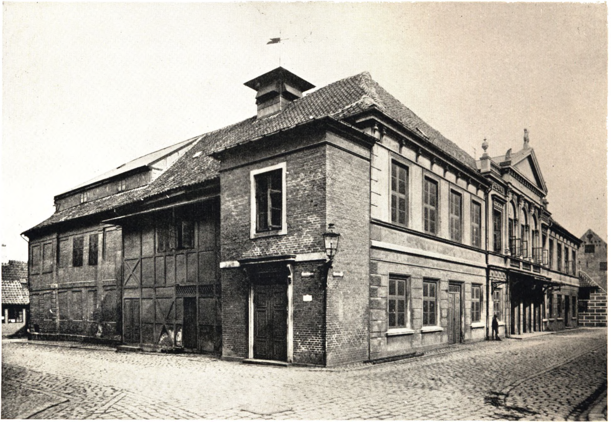
Odense gamle Theater paa Sortebrødretov — Odense nye Theater i Jernbanegade