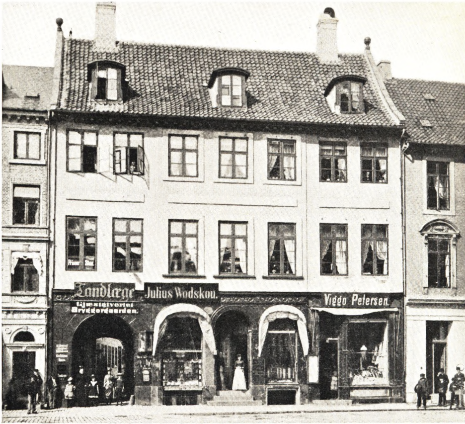
Bryggergaarden, Vestergade 11