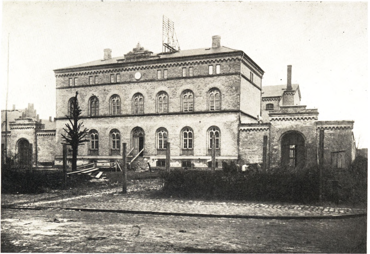
Ting- og Arresthuset — Domhuset