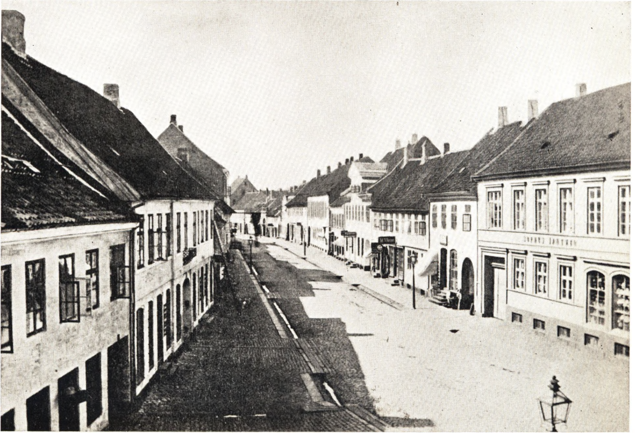
Vestergade set fra St. Knuds Hjørne