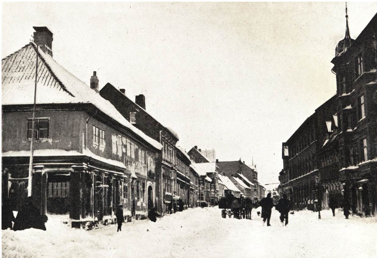
Nørregade set fra Frelsens Krog