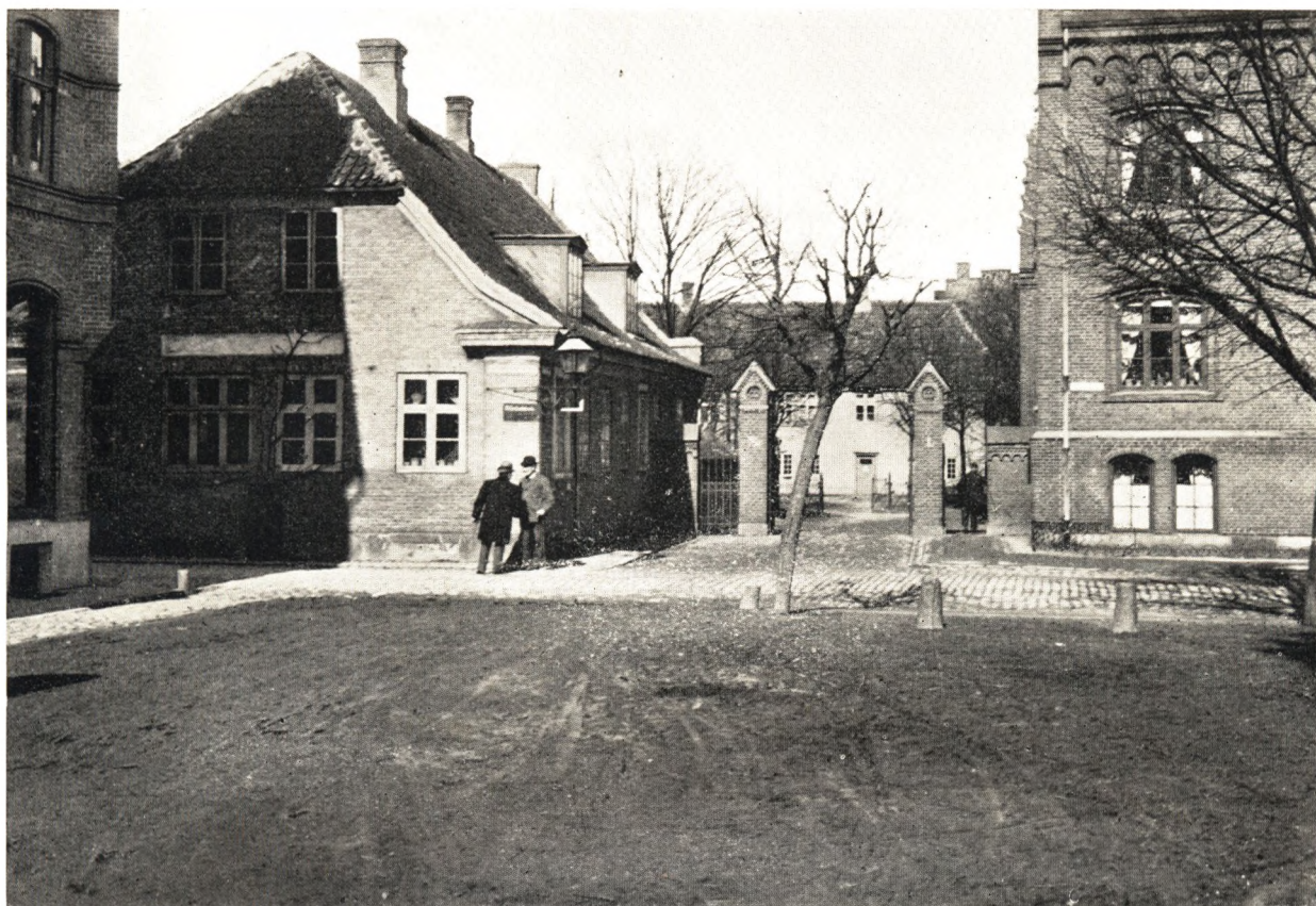
Graabrødre Plads for Anlæggelsen af Jernbanegade — Jernbanegade set fra Graabrødre Plads