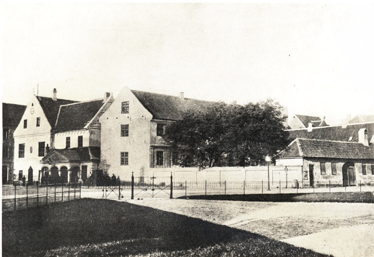
Flakhaven med Raadhuset