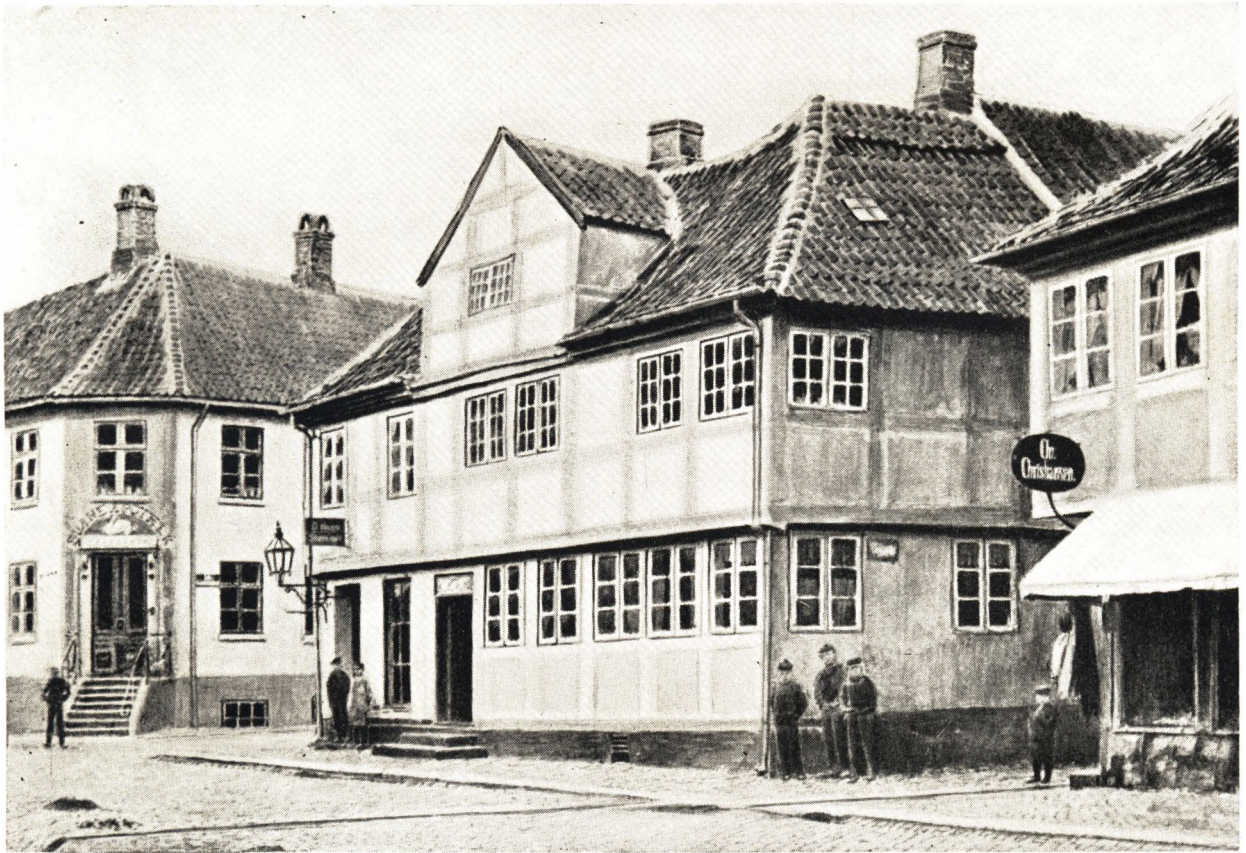
Parti af Vestergade ved Svaneapoteket