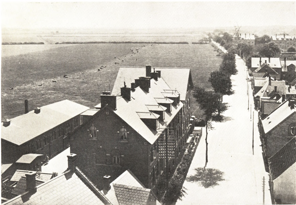
Udsigt fra Vandtaarnet