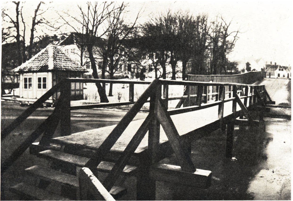
Klaregade set fra Hunderupvej