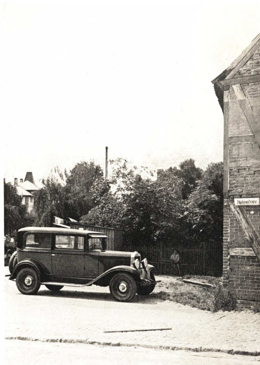
Filosofgangen (før og efter Bagaaens Opfyldning)