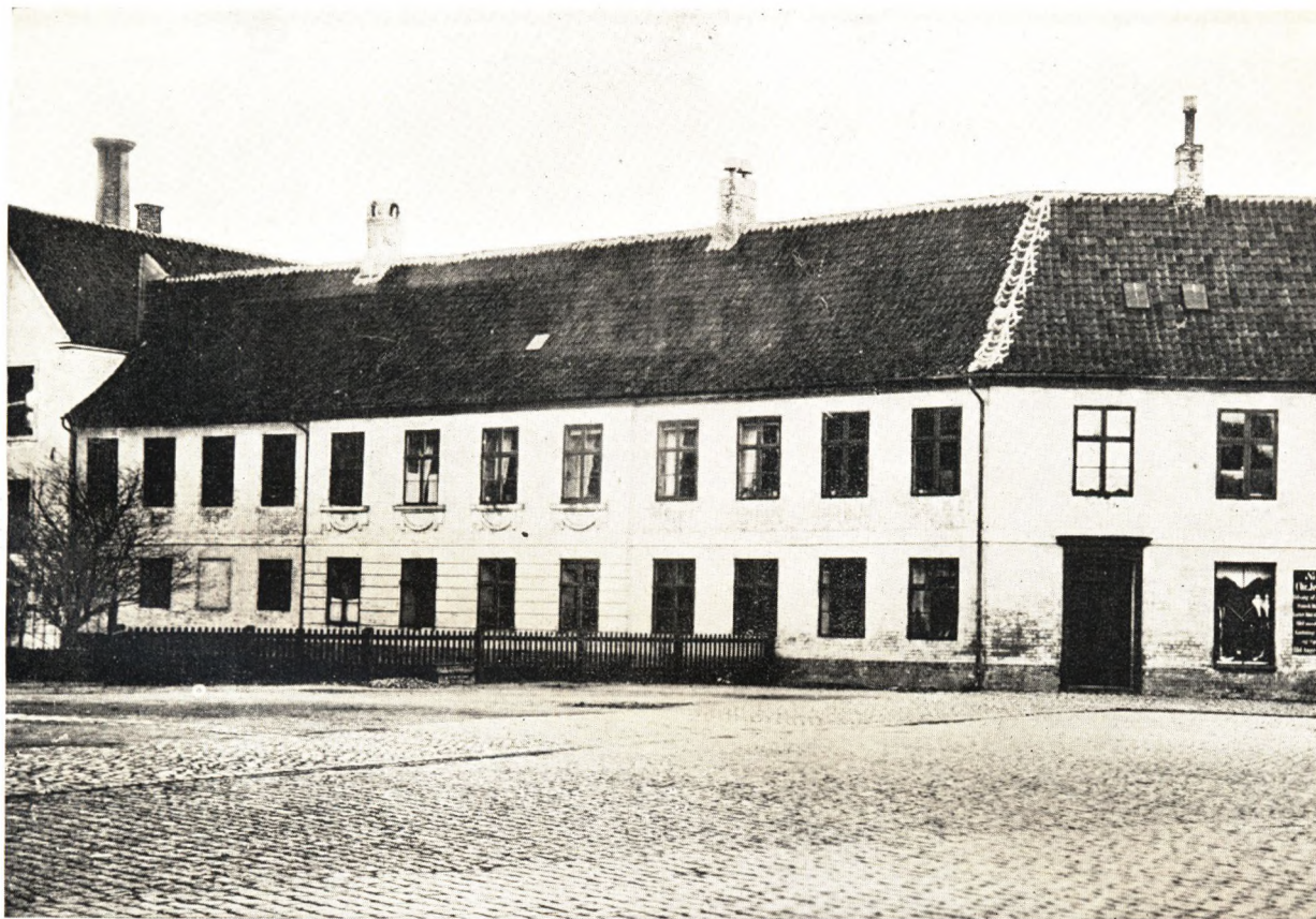
Klingenberg med Hempels Gaard, og Klingenberg efter Gennemførelsen af Klosterbakken