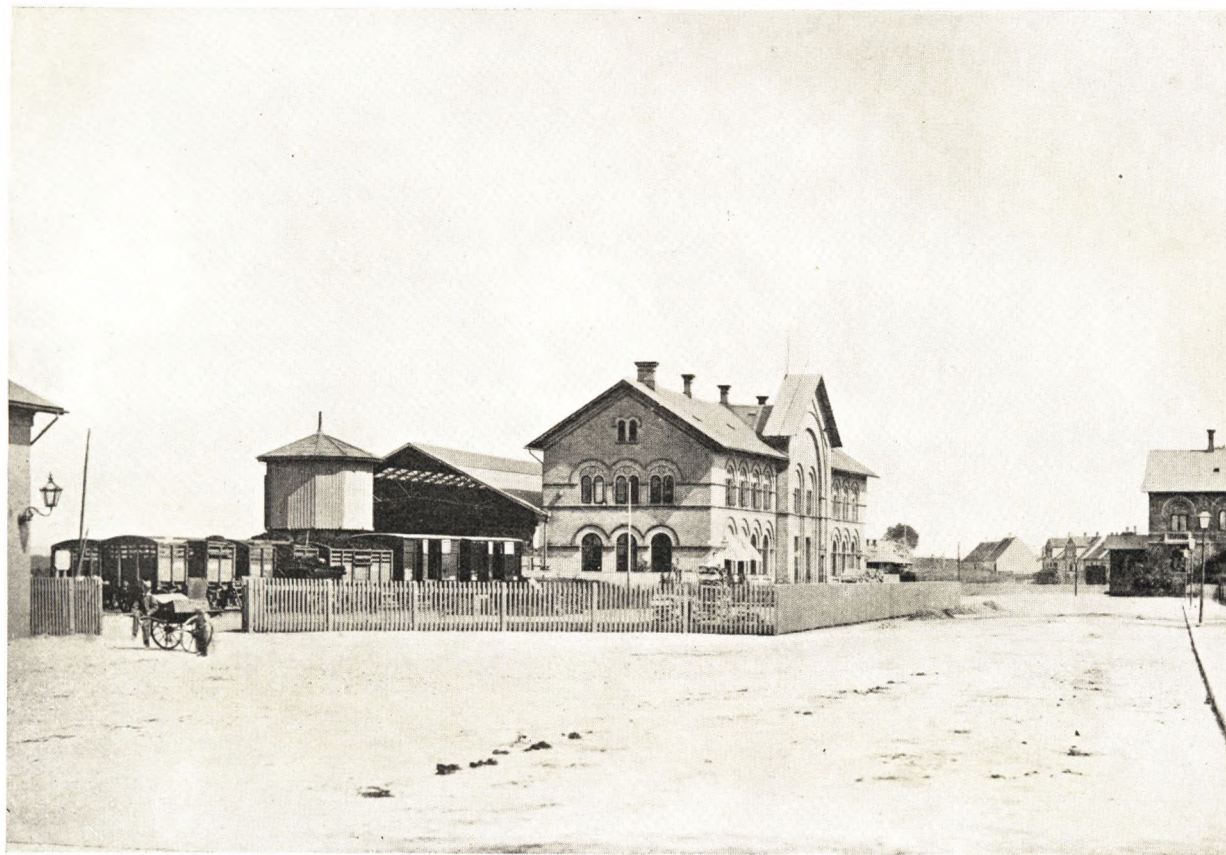
Den første Banegaard — Den anden Banegaard (nu Godsbanegaard). I Baggrunden den ny Personbanegaard