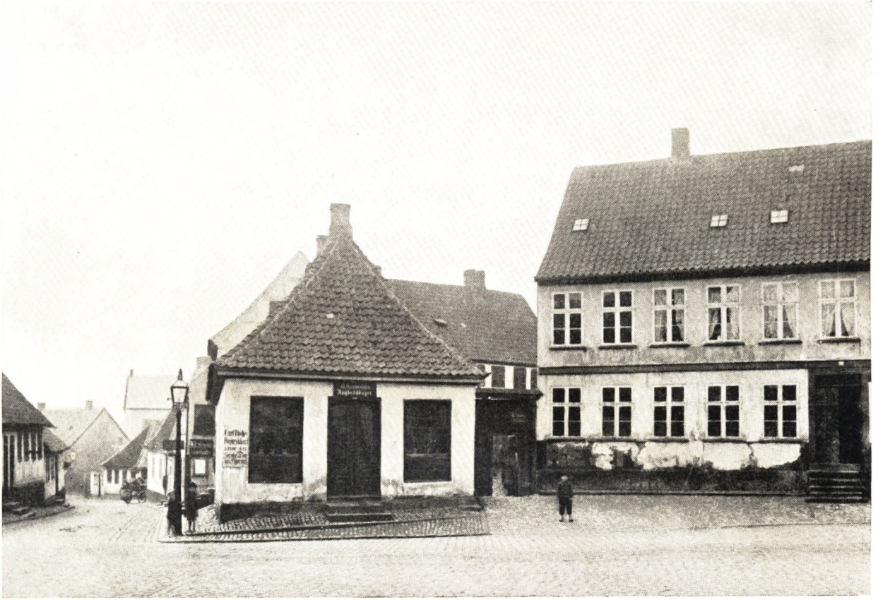
Parti af Klingenberg med Munkemøllestræde