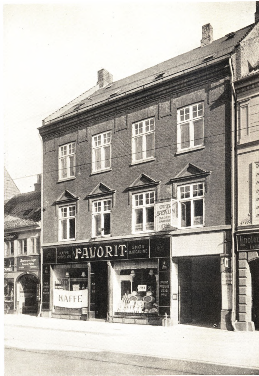
Østerbyes Gaard, Vestergade 76