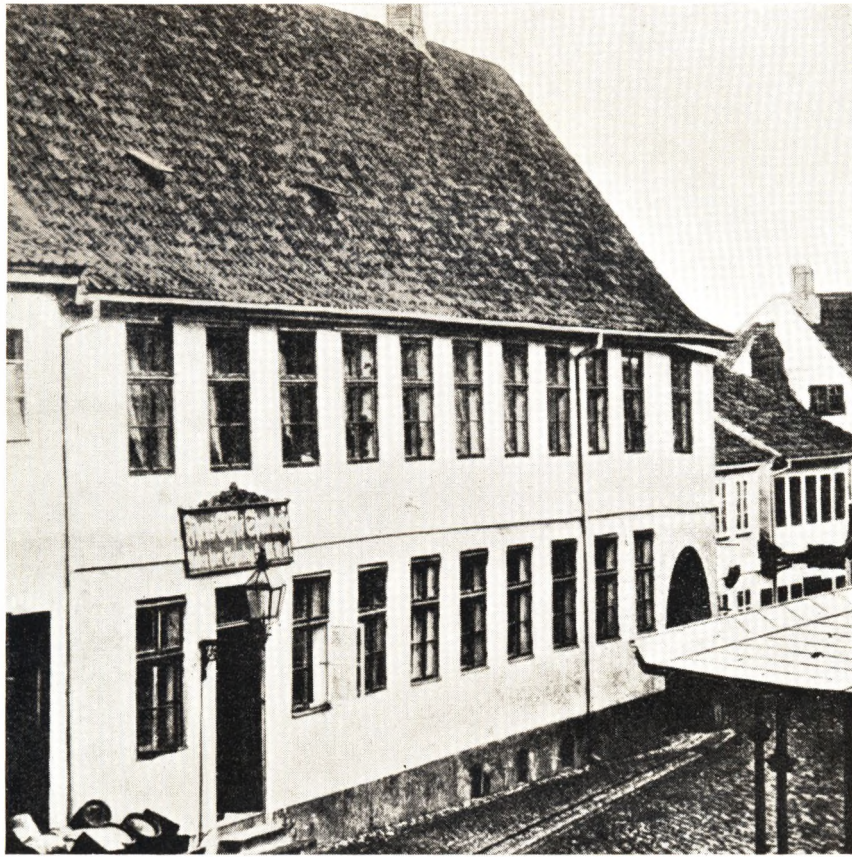
Fisketorvet med Fyens Stifts Sparekasse