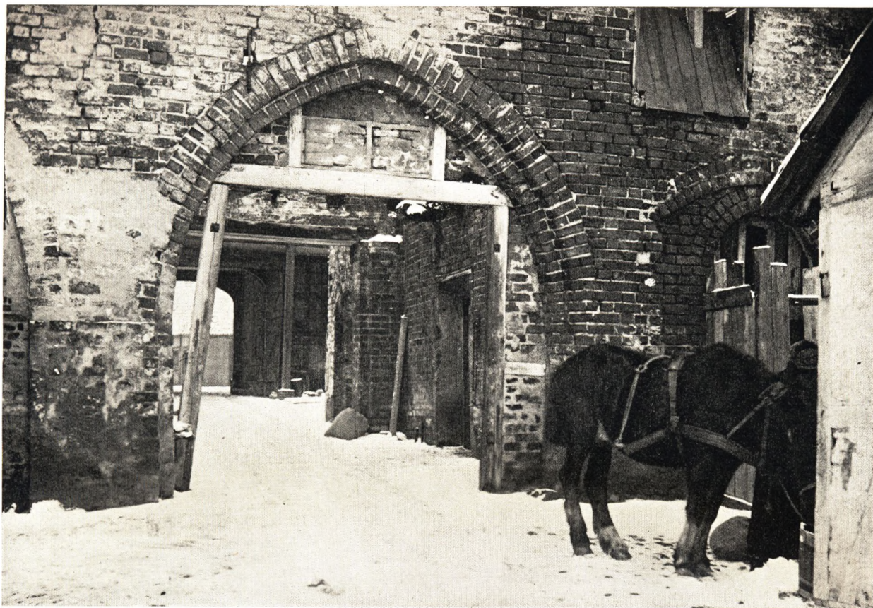
St. Knuds Kloster