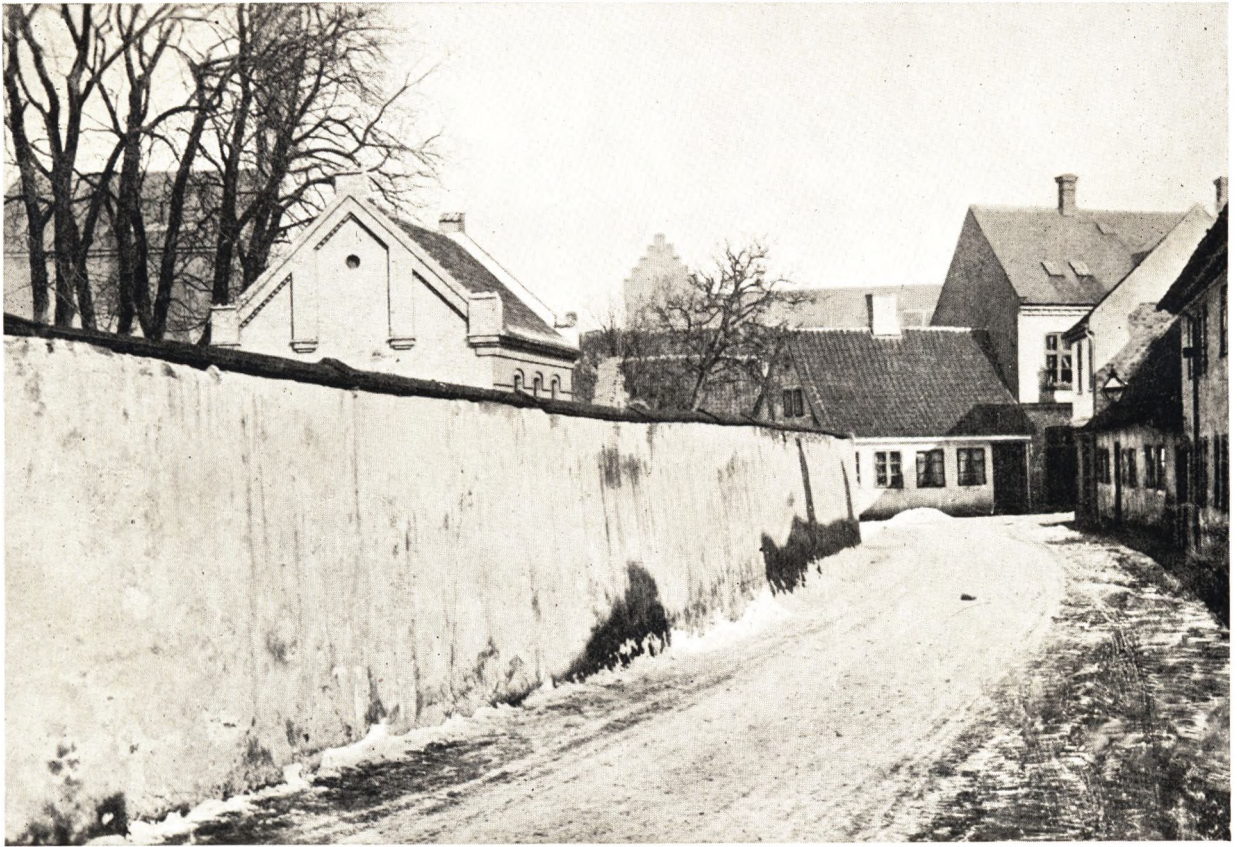
Asylgade med Graabrødre Klosters Have