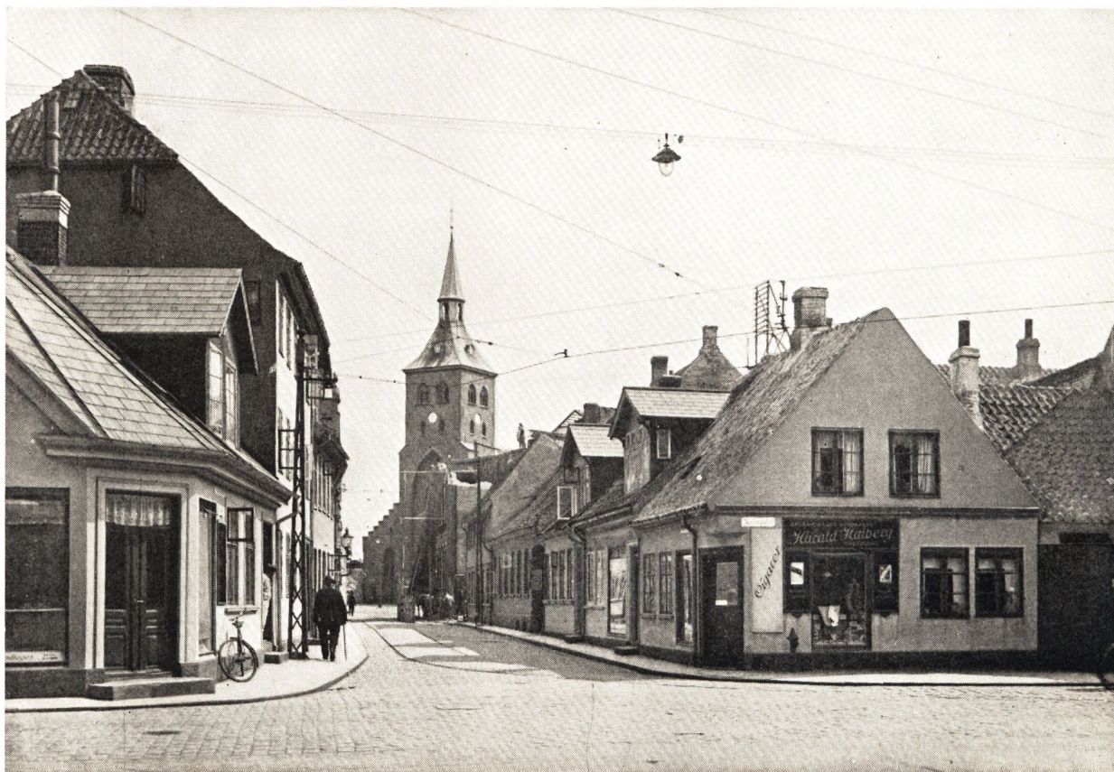
St. Knuds Kirkestræde