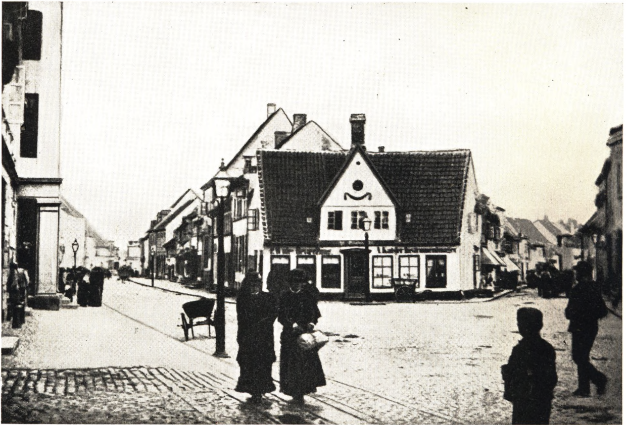
Overgade med »Skjolden«