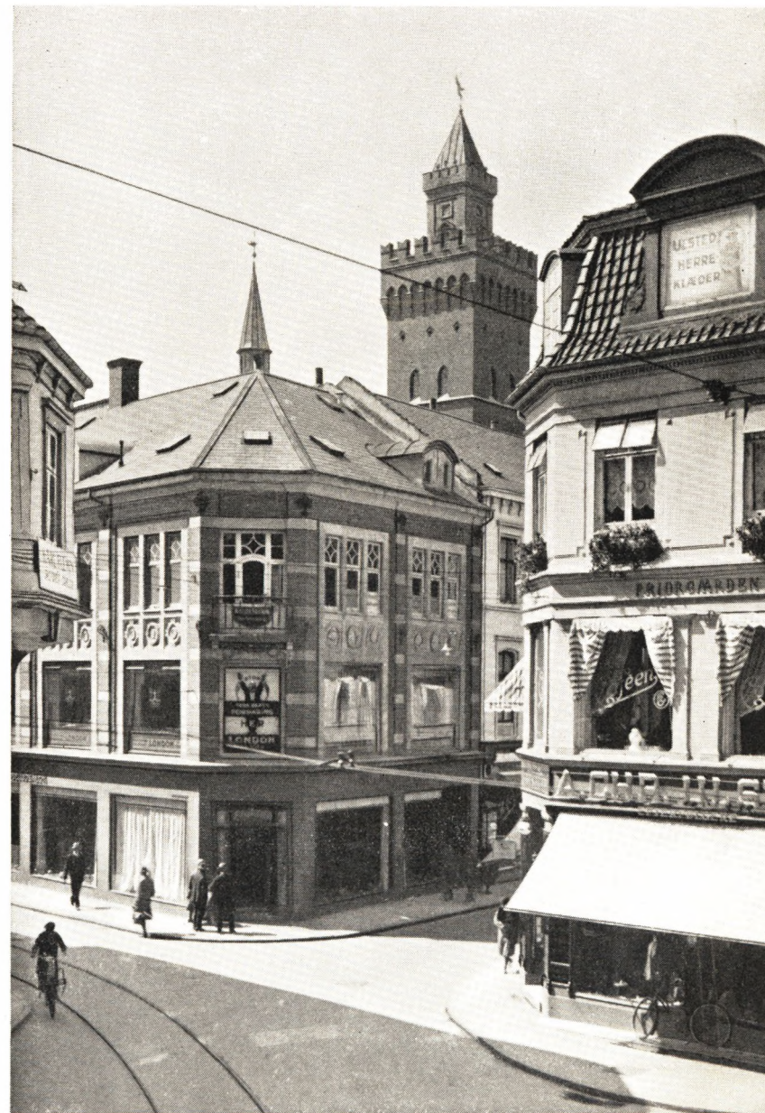
Hjørnet af Korsgade og Vestergade