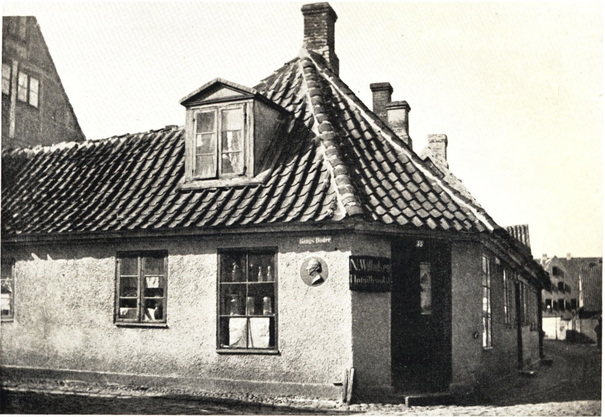
H. C. Andersens Hus og Mindehallen