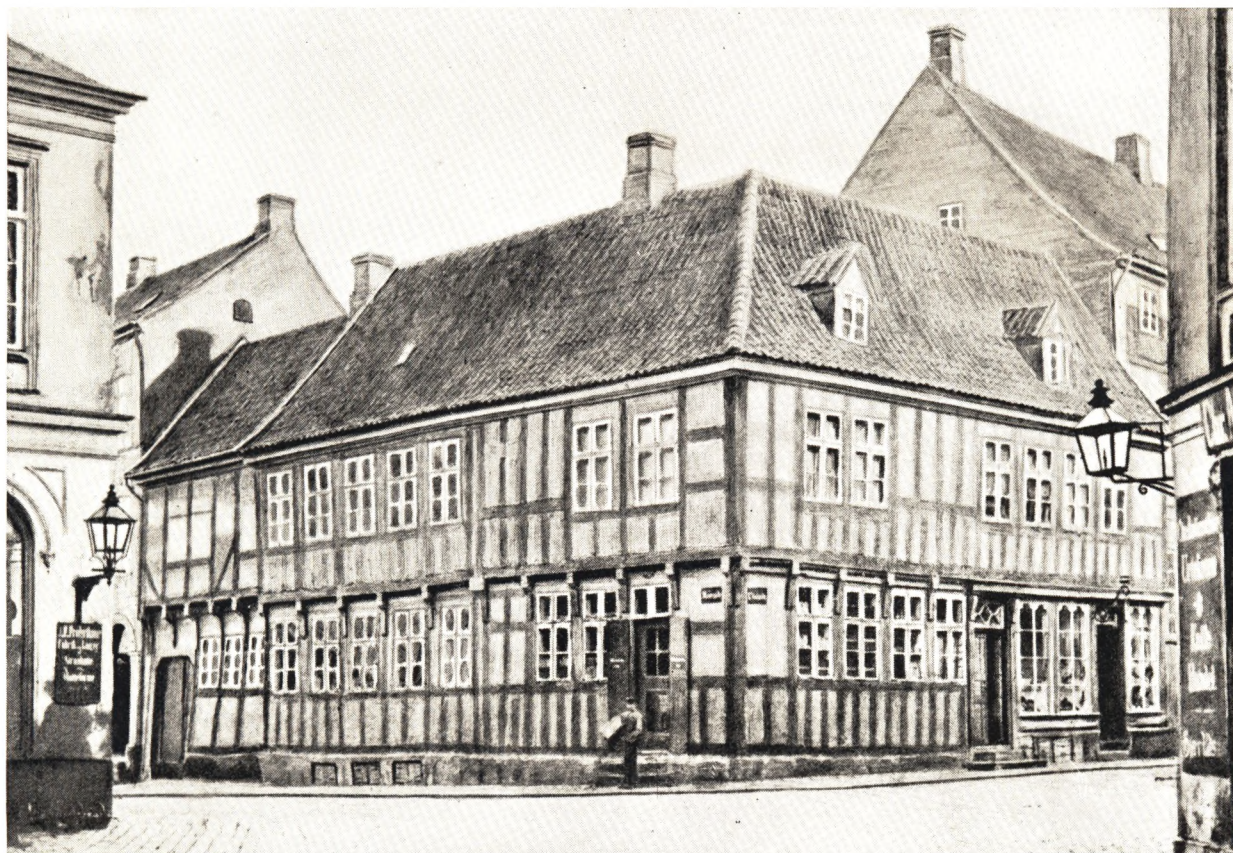
Overgade med Løveapothekets Hjørne