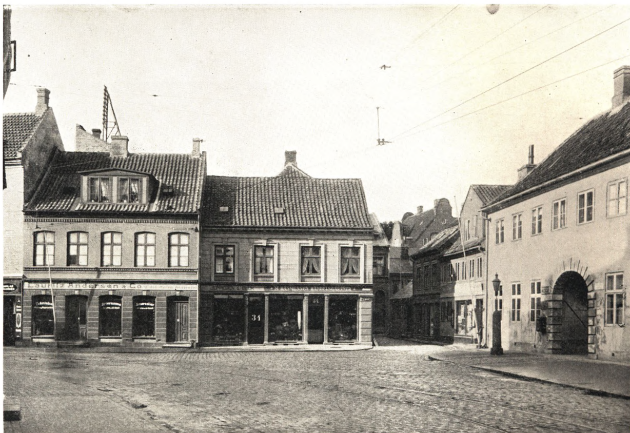
Hjørnet af Nørregade og Vindegade — Nu Asylgades Forlængelse