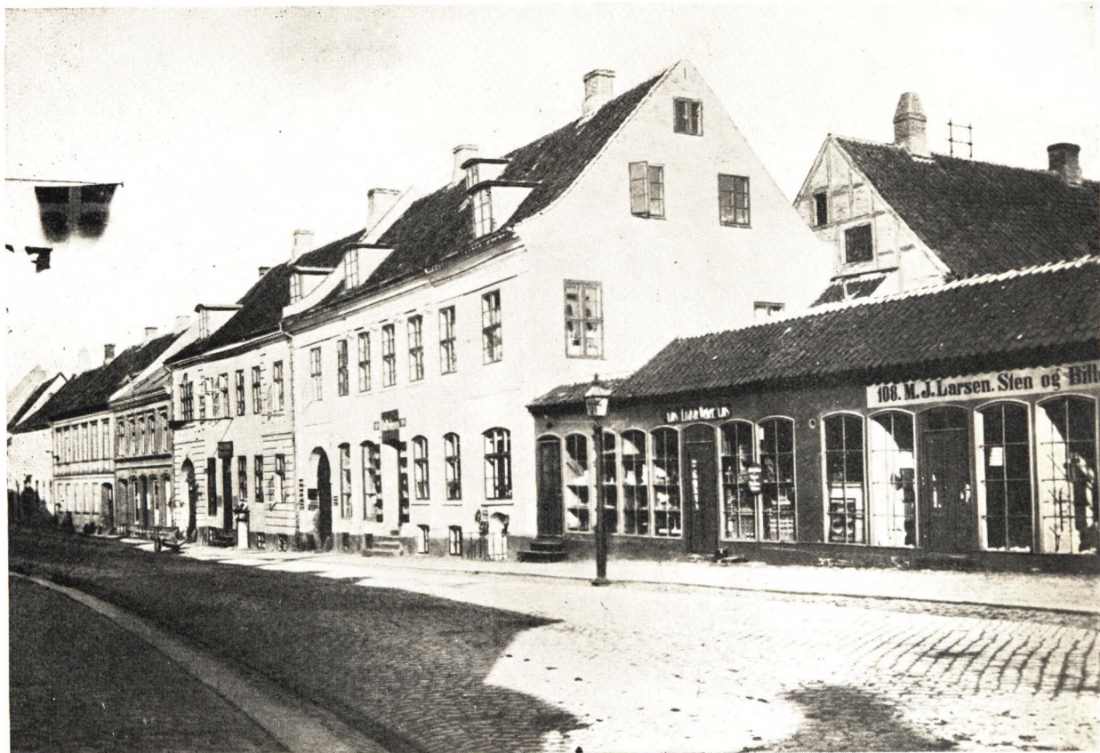
Parti af Vestergade med Hjørnet af Ny Vestergade