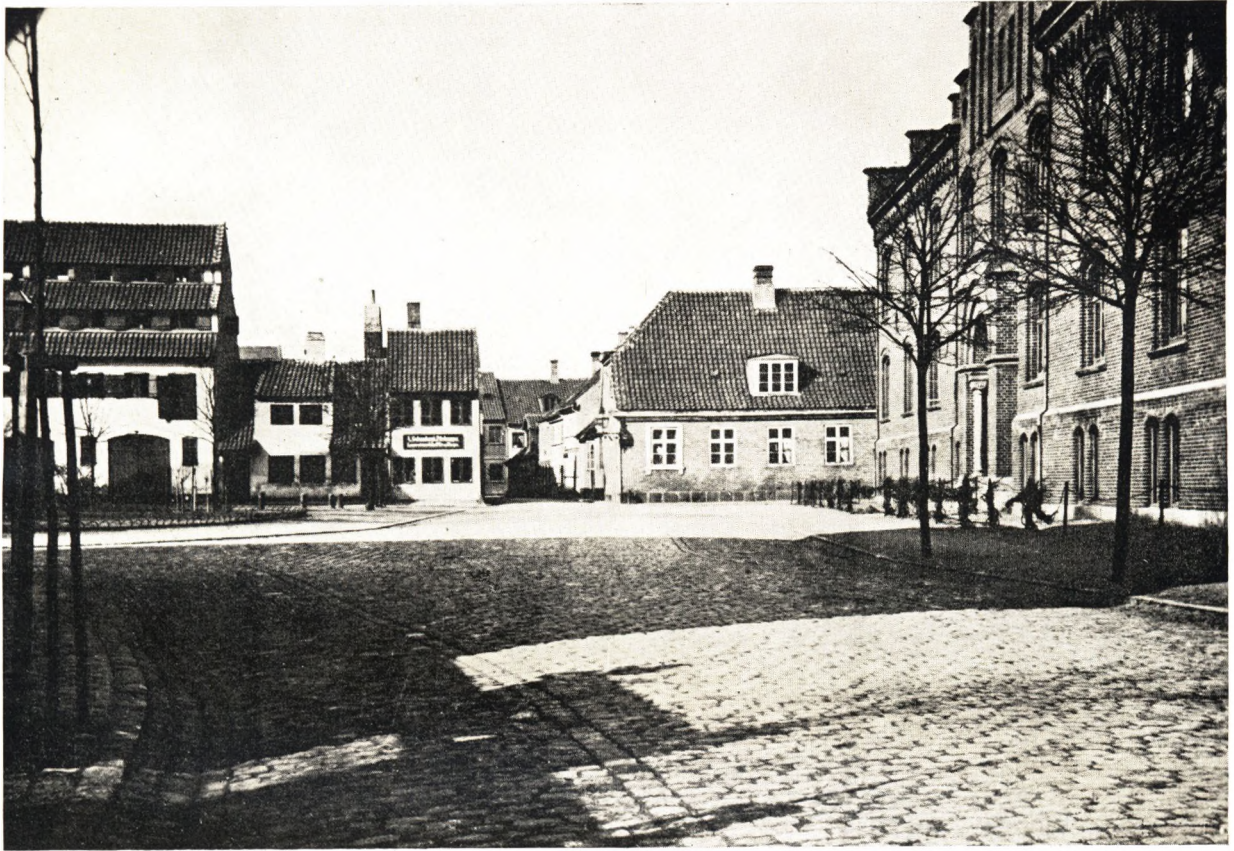
Graabrødre Plads med Graabrødre Kloster