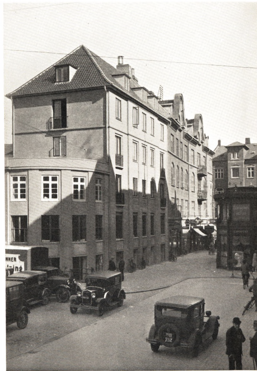
Fyens Stiftstidendes Ejendom, Graabrødre Plads