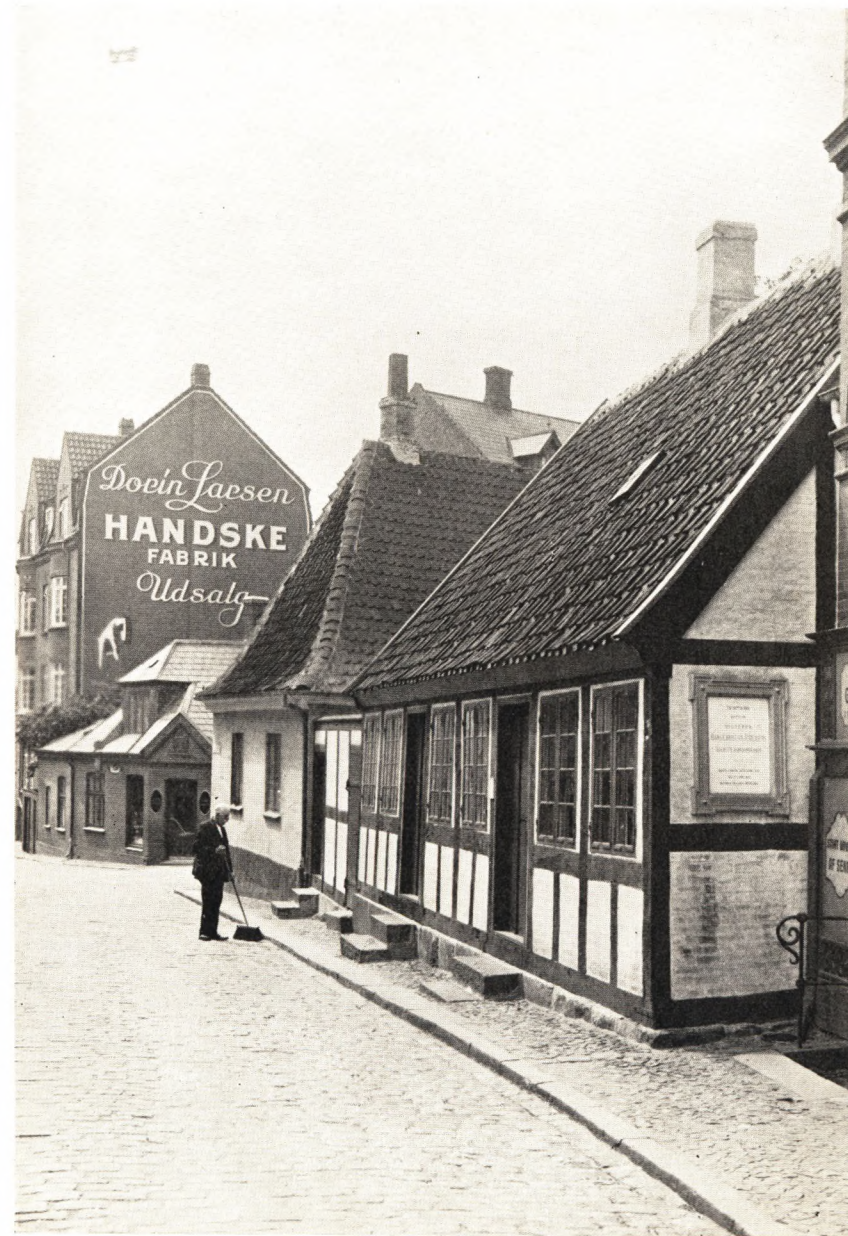
Munkemøllestræde med H. C. Andersens Barndomshjem før og efter Ombygningen