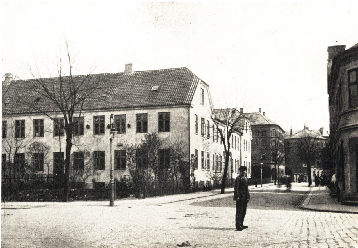
Vindegade set fra Kongensgade