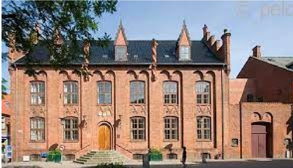
Næstved ting- og arresthus.