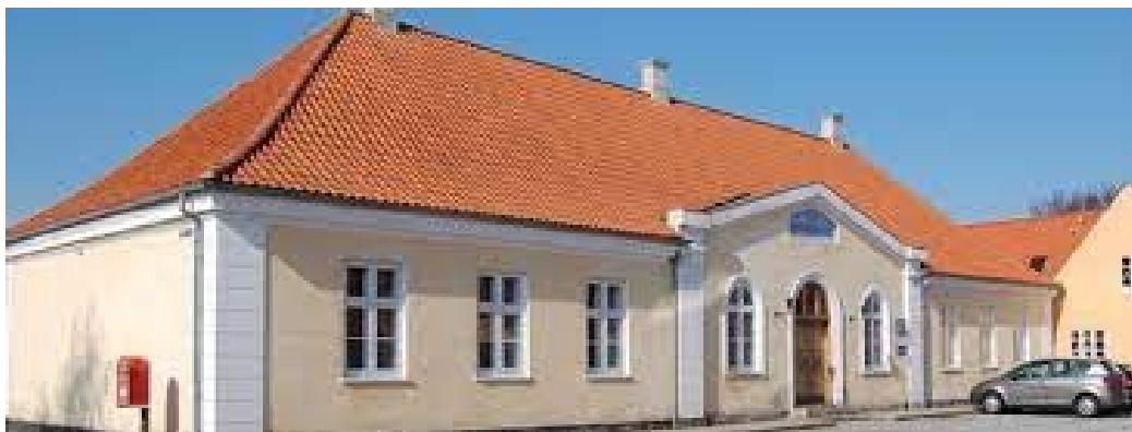
Sæby Arrest- og Tinghus.